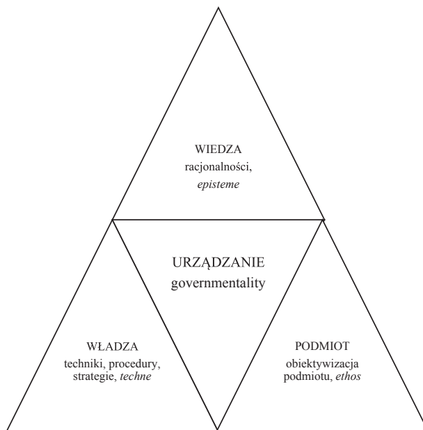
Schemat 1. Urządzanie jako perspektywa badawcza uwzględniająca wymiary wiedzy, władzy i podmiotu

Urządzanie jest dzisiaj szczególną perspektywą badawczą , w której uwzględniane są w badaniu trzy opisane wyżej komponenty: wiedzy, władzy i podmiotu (zob. schemat 1).