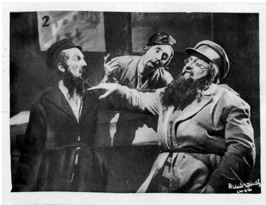
Fot. 2 CHI, 1930, nr 13, s. 3.

osoby i budujące nastrój fotografii. Warto przywołać wcześniejsze słowa Kingi Kenig mówiące o tym, że fotografia prasowa nie może pozwolić sobie na kreacjonizm. Jak widać, w zależności od czasów i przyjętych norm, takie działania były dopuszczalne, gdyż gwarantowały idealny komunikat wizualny pomiędzy wydawcą a czytelnikiem.