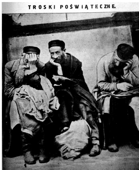
Fot. 1 Menachem Kipnis, Troski poświęteczne , NPI, 1926, nr 39, s. 1.

obrazy te są ciekawe i dążą do oddania istoty sytuacji, jaką widział Kipnis. Jest to w tym wypadku niezwykle cenna cecha 15 .