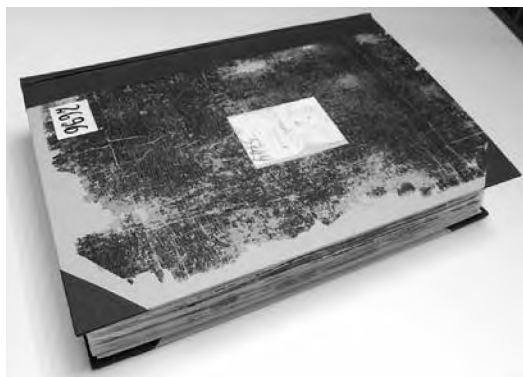
Księga meldunkowa miasta Bydgoszczy, sygn. 2873, stan po konserwacji.

oprawę bloku w nowe tektury. Wycięto tektury w oryginalnym rozmiarze. Oryginalny marmurek zdublowano na papier czerpany i oklejono nim tektury. Tak przygotowane okładziny zawieszono na bloku przy użyciu sznurków wklejonych w grzbiet oraz pasek płótna. Wycięto grzbietówkę do odpowiedniego rozmiaru i wklejono ją na pasek papieru japońskiego. Delikatnie wyokrąglono i naklejono na oprawę. Na grzbiet i narożniki naklejono nowe płótno introligatorskie. Od strony wewnętrznej wklejono wyklejki wykonane z papieru Palatina. Dodatkowo dla książki wykonano pudło ochronne.