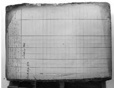
Księga meldunkowa miasta Bydgoszczy, sygn. 2696, zniszczenia bloku i oprawy.

Grzbiety składek były silnie zabrudzone oraz pokryte klejem zwierzęcym (co przyczyniło się do ich osłabienia i – miejscami – przerwania). Oprawa książki tylko częściowo połączona była z blokiem – zwięzy przy przedniej okładzinie były przerwane (Fot. 2). Płótno w oprawie było silnie zabrudzone i miejscami popękane. Tektura okładek była zdeformowana i miejscami rozwarstwiona, posiadała również liczne zaplamienia. Marmurek, który znajdował się