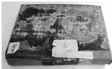
Księga meldunkowa miasta Bydgoszczy, sygn. 2696, stan przed konserwacją.

Księga o sygn. 2696 i wymiarach 41 x 26 x 7,8 cm, tak jak większość zbioru Ksiąg Meldunkowych była bardzo silnie zniszczona i zabrudzona (Fot. 1). Papierowy blok księgi był bardzo silnie zanieczyszczony i zakwaszony, co skutkowało jego silnym osłabieniem. Papier był żółcony i kruchy. Na całej grubości bloku, przy krawędziach, widoczne były liczne ubytki i duże przedarcia.