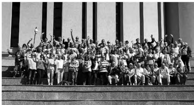
Polscy lekarze urzeczeni Bydgoszczą.

Planowane przedsięwzięcie będzie doskonałą okazją do pokazania szacownemu gronu przedstawicieli środowiska lekarskiego urokliwych walorów zabytkowych i przyrodniczych oraz