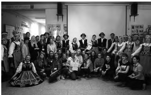
Młodzież z Litwy z Zespołem Pieśni i Tańca „Płomienie” w Bydgoszczy.