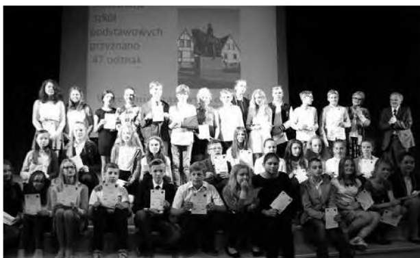
Laureaci Brązowych Odznak Młodego Przyjaciela Bydgoszczy.

Wręczono też 20 znaczków „Znawcy Kazimierza Wielkiego i Jego Miasta”. Zdobyl je uczniowie kl. V ze Szkoły Podstawowej nr 20 i 35. Wzięli oni udział w warsztacie sprawdzającym wiedzę i umiejętności dotyczą-