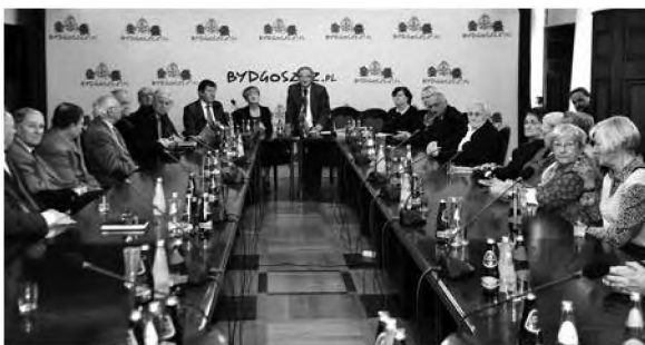
Jubileuszowe spotkanie z twórcami „Kalendarza Bydgoskiego” w 2016 roku.

Uczestniczyliśmy w posiedzeniu Towarzystwa Miłośników Miasta Inowrocławia, podczas którego zapadła decyzja o przyznawaniu tytułów Honorowego Członka Stowarzyszenia. 17 listopada 2016 r., z okazji 500 rocznicy urodzin wybitnego poety Klemensa Janickiego, nasza delegacja uczestniczyła w odsłonięciu tablicy pamiątkowej poety na budynku Szkoły Podstawowej w Januszkowie, 6 stycznia 2017 r. w X Jubileuszowym Spotkaniu Oplątkowo-Noworocznym Żnińskiego Towarzystwa Kultury, jubileuszu 40-lecia Towarzystwa Miłośników Ziemi Koronowskiej, a potem w Walnym Zebraniu, podczas którego