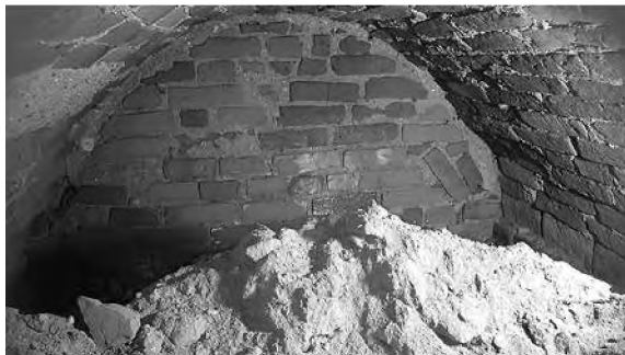
Niedawno odkryta krypta w bydgoskiej Katedrze.

Przypomnijmy, DAG-Fabrik Bromberg był to niemiecki zakład zbrojeniowy, który zatrudniał tysiące pracowników, pracowników przymusowych i jeńców. Część zachodnia DAG Kaltwasser – Zimne Wody, kryptonim „Torf” przeznaczona była do wytwarzania prochów strzelniczych. Dzielila się na NC-Betrieb – produkcja nitrocelulozy, POL-Betrieb – obróbka końcowa prochów bezdymnych z placem prób balistycznych, NGL-Betrieb – produkcja nitrogliceryny, a także ciasta prochowego. W strefie laboratoriów