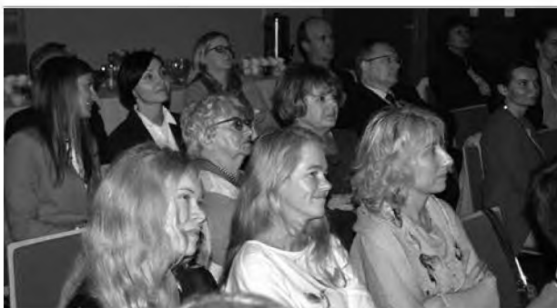
Fragment sali posiedzeń widowni podczas V Ogólnopolskiej Konferencji Naukowej „Architektura Miast – Zieleni w krajobrazie miasta XIX i XX w.” w KPCK w Bydgoszczy