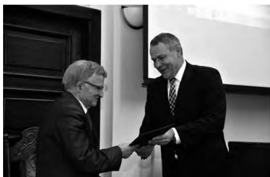
Prezydent Bydgoszcz Rafal Bruski składa deklarację wstąpienia do TMMB.