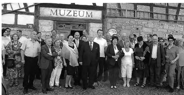
Polscy regionaliści przed Muzeum Przesiedleńców i Wypędzonych w Pławnej.

Jest oczywiste, że tego typu inicjatywy powinny być kontynuowane w przyszłości. Wzorem woj. dolnośląskiego także w innych regionach Polski. Bo odgrywają one ważną rolę w upodmiotowieniu społeczeństw lokalnych, w wyzwaniu ich społecznej pasji i upowszechnianiu cennych inicjatyw.