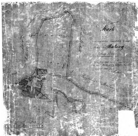
Sygn. 1356, stan po konserwacji

Następnym etapem było usunięcie bibuły służącej do transferu fragmentów mapy. Lico zwilżono delikatnie wrzątkiem i usunięto bibułę oraz nadmiar kleju. Z uwagi na bardzo uszkodzony papier powierzchnię mapy zabezpieczono dodatkową warstwą bibuły japońskiej i pokryto 2-procentowym roztworem tylozy. Mapę suszono w prasie introligatorskiej.