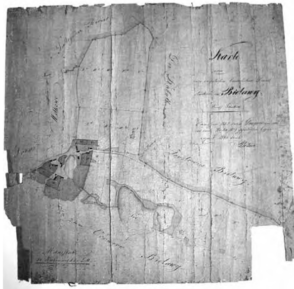
Sygn. 1356, stan przed konserwacją

Wybrane do konserwacji mapy uwłaszczeniowo-regulacyjne o sygn. 1356, 1006, 961 należą do Zbioru map uwłaszczeniowo-regulacyjnych (nr 2255), liczącego 1900 j.a. 1 Są to mapy miejscowości położonych niegdyś na obszarze Prowincji Poznańskiej podzielonej na dwa okręgi rejencyjne z siedzibami w Bydgoszczy i Poznaniu. Palenzie Dolne i Sędowo należały do Rejencji Bydgoskiej, zaś Bielawy do Rejencji Poznańskiej. Wspomniane mapy mają zróżnicowaną proveniencję archiwalną. Pochodzą