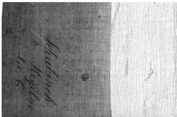
Sygn. 1006, odwrocie, w trakcie demontażu

Płótno dublażowe jest silnie zabrudzone i mocno przeklejone klejem glutynowym. Od strony odwrocia zostało powleczone grubą warstwą werniksu. Klej użyty do dublażu na płótno jest zdegradowany i częściowo utracił swoje właściwości, co grozi utratą następnych fragmentów mapy.