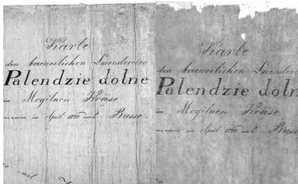
Sygn. 961, fragment przed i po konserwacji

Originalne płótna z atramentowymi zapiskami zostały zapakowane w bezkwasowe koperty i dołączone do odpowiadających im map.