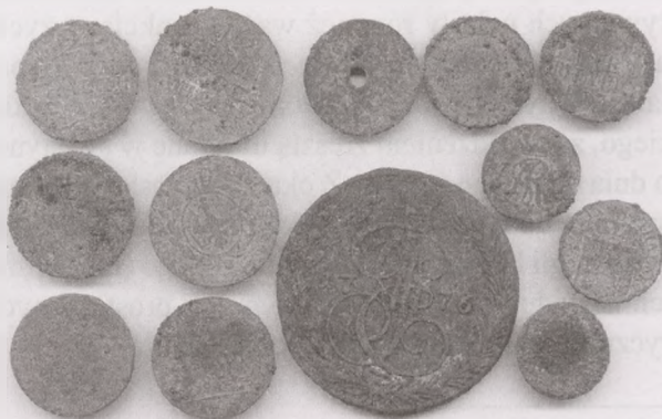
Fot. 3. Bydgoszcz, stanowisko 611 (Rynek 15), wykop 10, warstwa 7. Obiegowe monety z przełomu XVIII/XIX wieku. Stan przed konserwacją