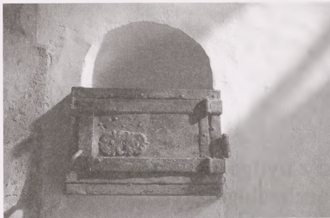
Fot. 1. Wrocław, skarbona z kościoła św. Elżbiety