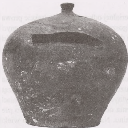
Fot. 2. Skarbonka z okresu rzymskiego ze zbiorów Uniwersytetu Jagiellońskiego Wg J. Śliwa, Rzymska skarbonka hr. Józefa Wodzickiego, „Alma Mater” 2003, nr 49