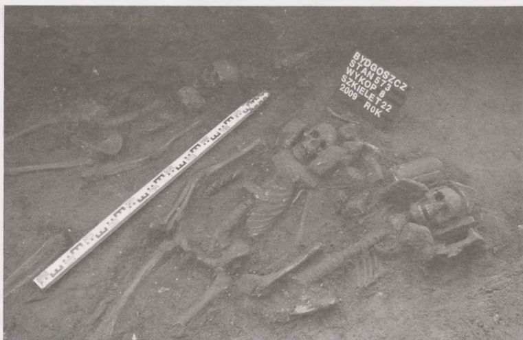
Ryc. 11. Bydgoszcz, stanowisko 573, ulica Marszałka Focha. Wykop 8. Przykościelny cmentarz. Poziom pochówków z XVII-XVIII wieku