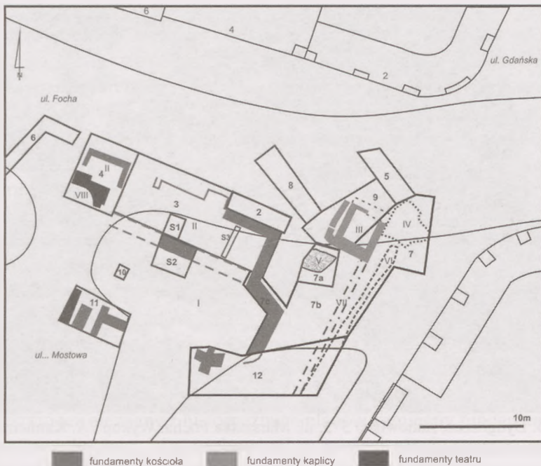
Ryc. 3. Bydgoszcz, stanowisko 573, ul. Marszałka Focha. Plan wykopów na terenie klasztoru Karmelitów