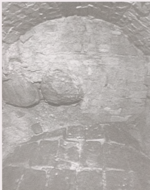
Ryc. 7. Bydgoszcz, stanowisko 573, ul. Marszałka Focha. Wykop 3, sondaż 1. Zachodnia ściana krypty