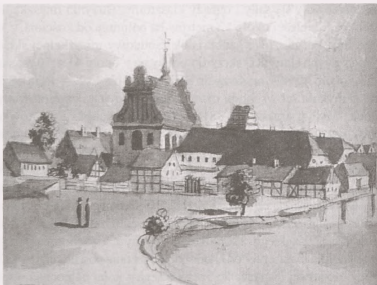
Ryc. 1. Bydgoszcz – kościół Karmelitów. Widok od zachodu (fragment). Autor nieznany. 1802 rok

Wł. Kultur und Documentationszentrum Westpreußen, Zamek Wolbeck Münster