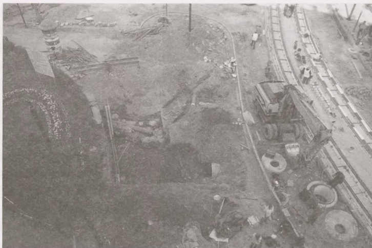
Ryc. 9. Bydgoszcz, stanowisko 573, ulica Marszałka Focha. Wykop 7B. Przykościelny cmentarz (poziom XV-XVI-wieczny) i kamienno-ceglane fundamenty prezbiterium