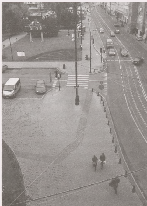
Ryc. 13. Bydgoszcz, ul. Marszałka Focha. Zarys prezbiterium i nawy kościoła Karmelitów w nawierzchni współczesnego chodnika