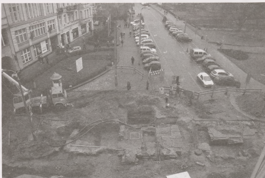
Ryc. 6. Bydgoszcz, stanowisko 573, ulica Marszałka Focha. Wykop 3, 4. Przyziemia przykościelnych kaplic (XVII-XVIII wiek). Narożnik teatru spalonego w 1945 roku