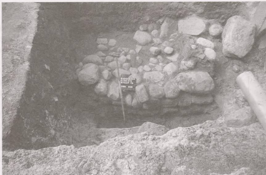
Ryc. 5. Bydgoszcz, stanowisko 573, ul. Marszałka Focha. Wykop 7A. Kamienny fundament dzwonnicy