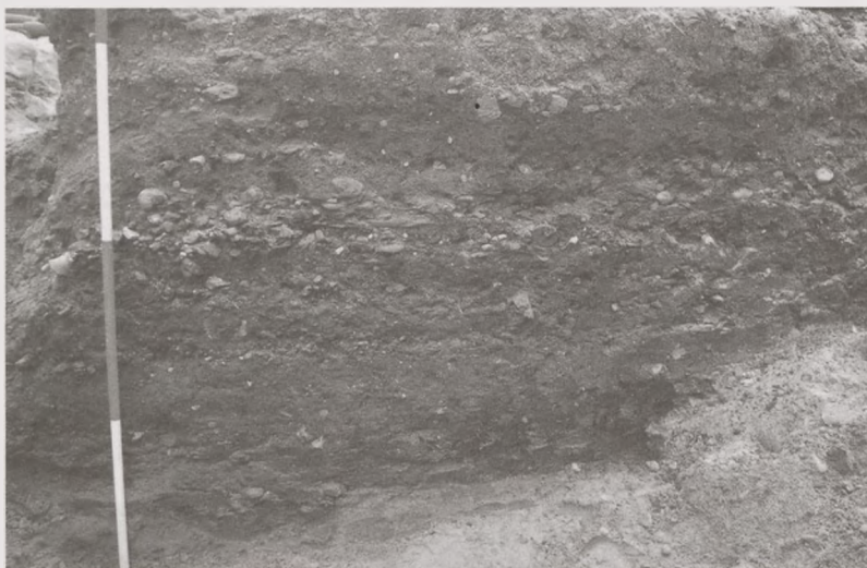
Ryc. 4. Bydgoszcz, stanowisko 573, ul. Marszałka Focha. Wykop 5. Przekrój nawarstwień drogi