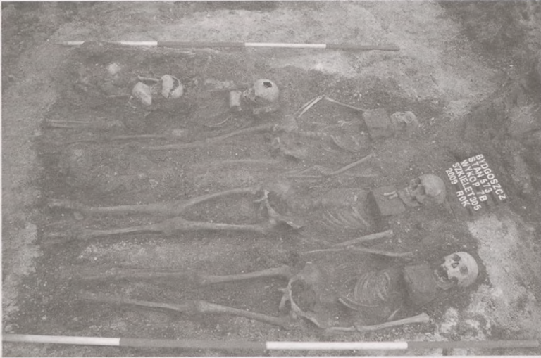
Ryc. 12. Bydgoszcz, stanowisko 573, ulica Marszałka Focha. Wykop 7B. Przykościelny cmentarz. Poziom pochówków z XV wieku