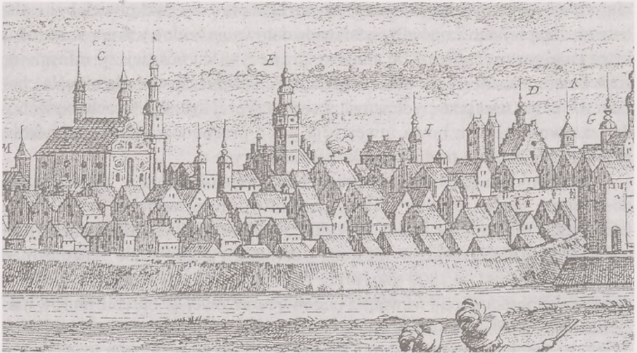
Ryc. 1. Fragment widoku Bydgoszczy od strony południowej z ratuszem (litera E). Miedzioryt z 1696 r. według rysunku Erika J. Dahlberga z 1656 r.