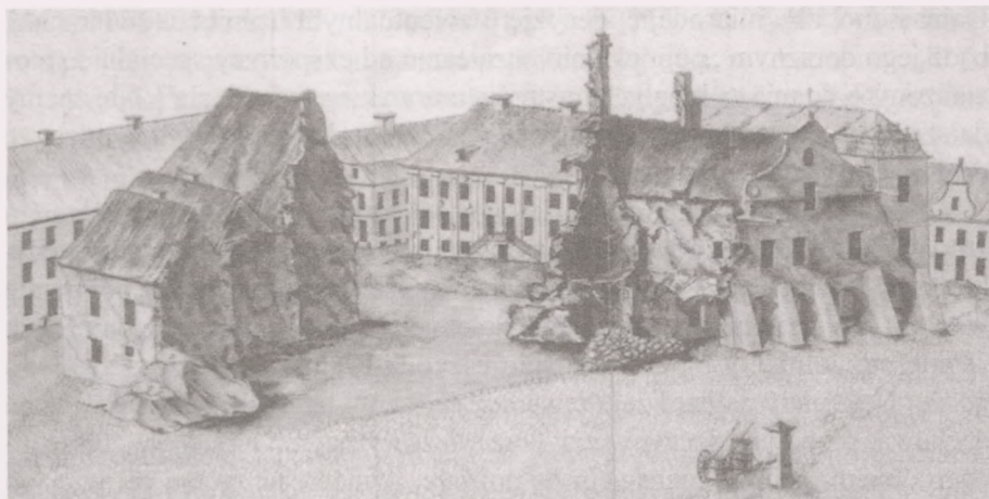
Ryc. 7. Widok bydgoskiego rynku z 1829 r. Akwarela nieznanego autora

Na ratuszowym parterze znajdowało się z kolei więzienie „górne”, będące w istocie aresztem z dwiema co najmniej izbami 22 .