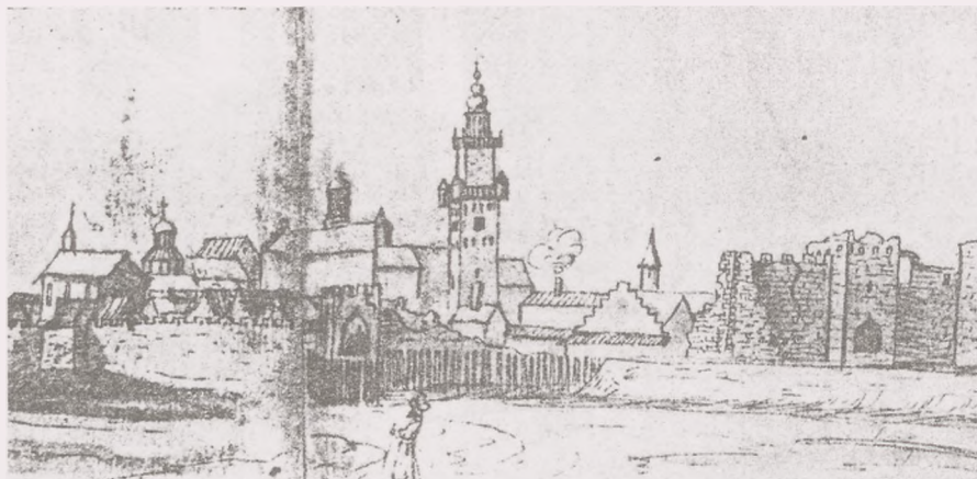
Ryc. 3. Fragment widoku Bydgoszczy od strony południowo-wschodniej z wieżą ratuszową. Rysunek z 1661 r. Johanna Rudolfa Storna