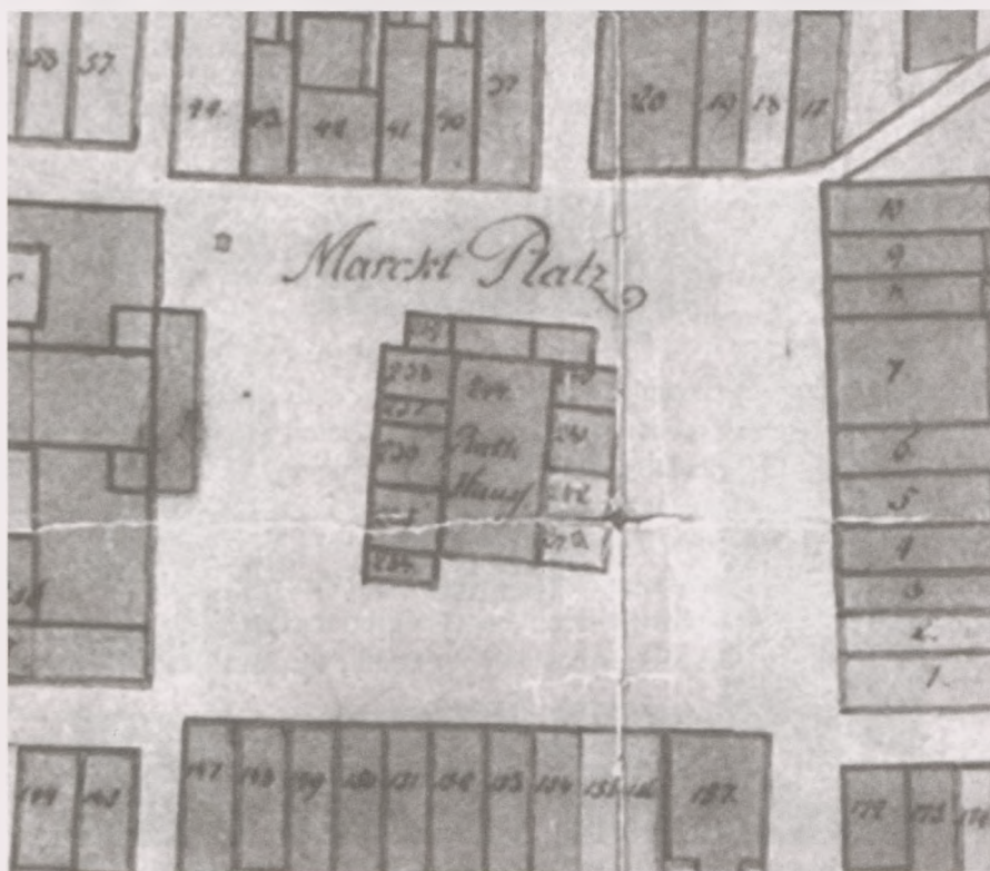
Ryc. 4. Rynek na planie Bydgoszczy z 1774 r., wykreślonym przez Paula Johanna Gretha