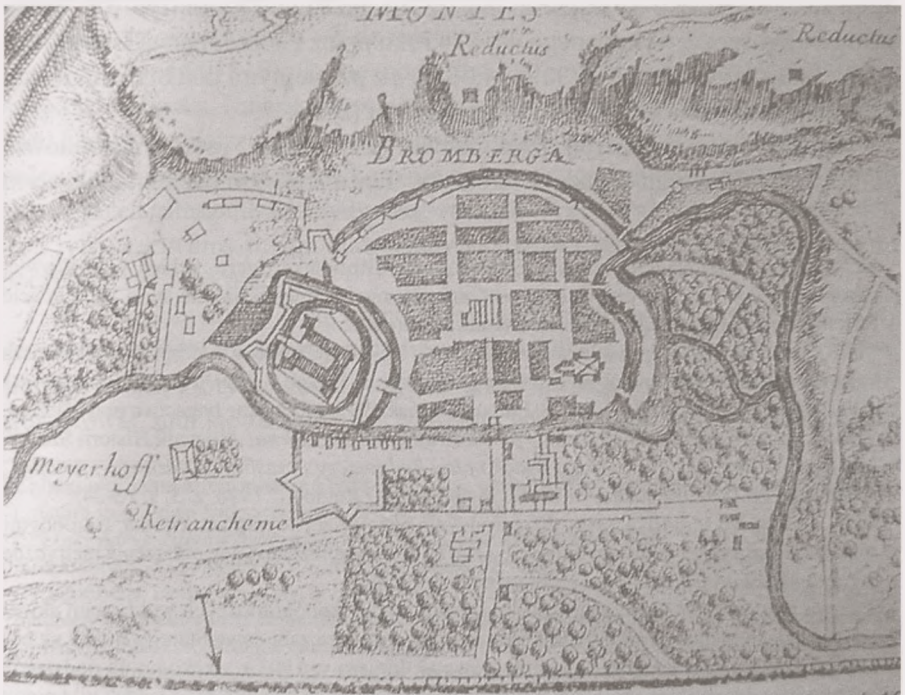
Ryc. 2. Poglądowy plan Bydgoszczy z 1656 r. (orientowany na południe). Miedzioryt z 1696 r. według rysunku Erika J. Dahlberga z 1656 r.