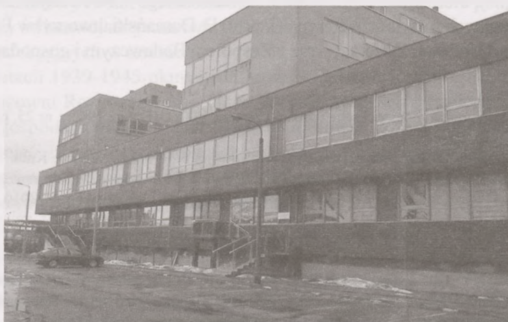
Ryc. 3. Zespół budynków zajmowanych m.in. przez Państwowy Instytut Weterynaryjny – Państwowy Instytut Badawczy w Puławach Oddział w Bydgoszczy oraz Wojewódzki Inspektorat Weterynarii przy al. Powstańców Wielkopolskich 10