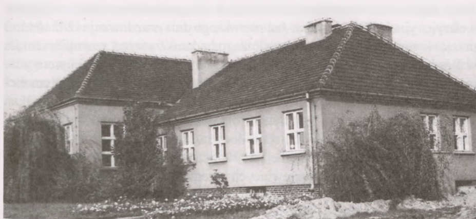
Ryc. 6. Państwowy Zakład Lecznicy dla Zwierząt w Bydgoszczy (PZLZ), przy ul. Wybickiego 2a. Zdjęcie wykonane w 1963 r.