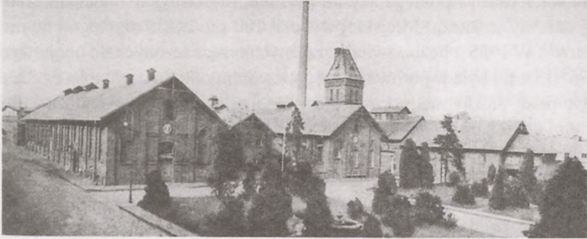
Ryc. 5. Panorama Rzeźni Miejskiej w 1930 roku

1924-1927 brał udział w pracach nad podstawowym ustawodawstwem w zakresie medycyny weterynaryjnej 29 . Zmarł 6 IV 1930 r. w Warszawie, pochowany został jednak w Bydgoszczy 30 . Był odznaczony Komandorią Orderu Polonia Restituta.