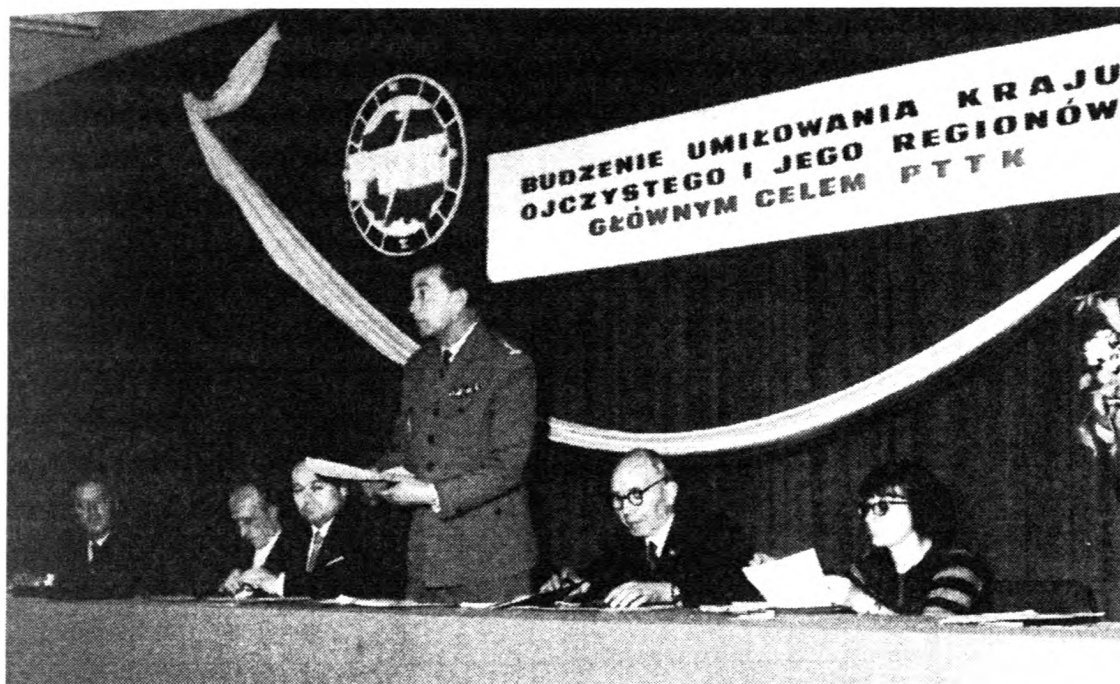
Prezydium VIII Zjazdu Delegatów Oddziałów PTTK województwa bydgoskiego w dniu 21 maja 1972 r.