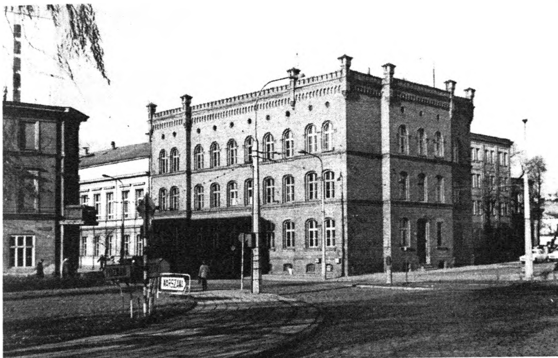
Budynek Prywatnej Szkoły Powszechnej „Rodziny Wojskowej” przy ul. Jagiellońskiej 13