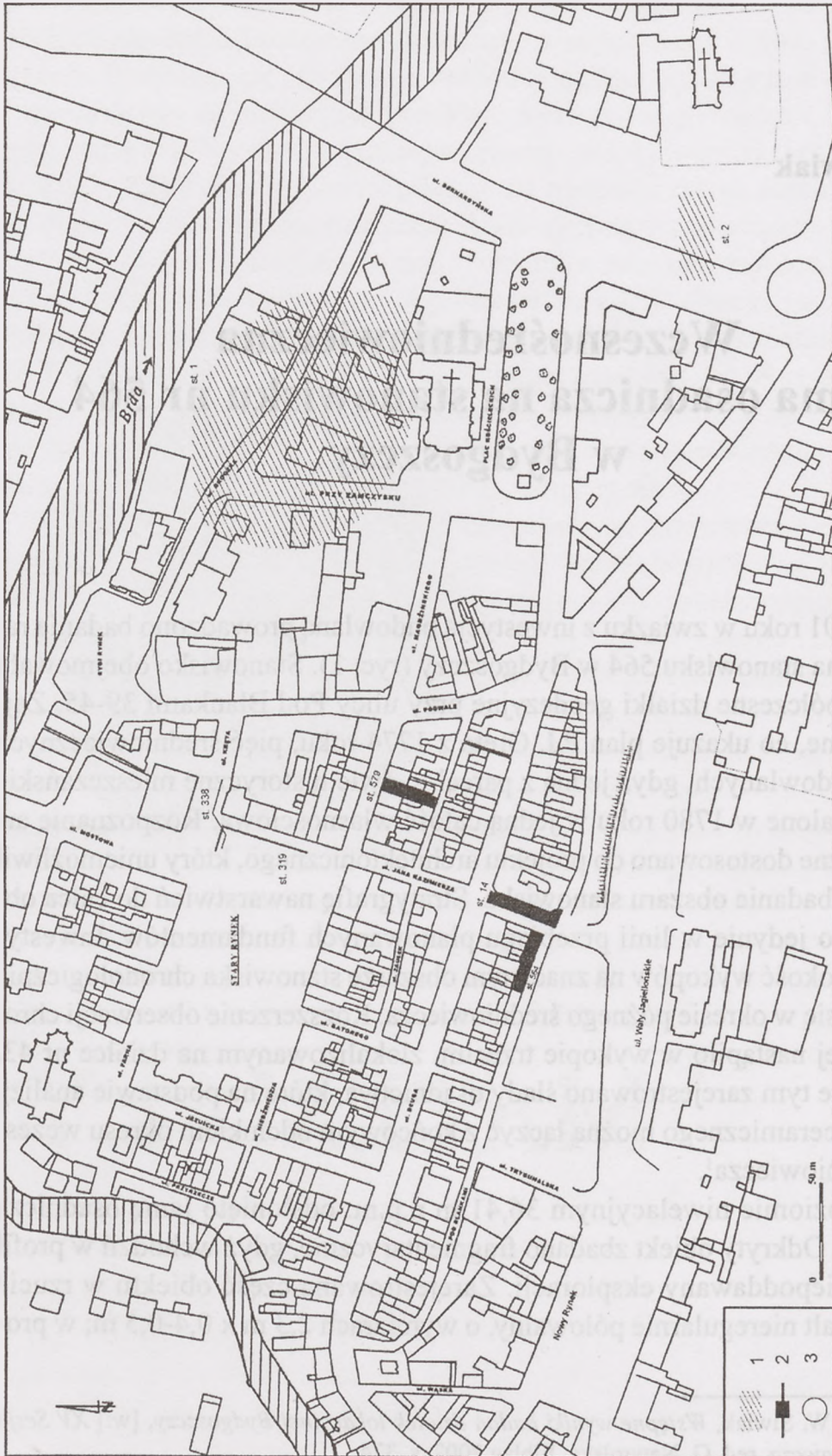
Ryc. 1. Bydgoszcz. Lokalizacja stanowisk ze znaleziskami wczesnośredniowiecznymi. 1. Stanowiska o przypuszczalnym zasięgu. 2. Wykopy archeologiczne i nadzorowane. 3. Lokalizacja obiektu 1