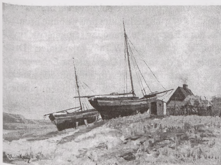
Walter Leistikow, Łodzie rybackie , ok. 1886, olej, tektura, nr inw. MOB/SO.10, własność: Muzeum Okręgowe im. Leona Wyczółkowskiego w Bydgoszczy

W roku 1887 Leistikow założył własne atelier. Nawiązał kontakty z awangardową elitą Berlina. Bywał u najwybitniejszych malarzy, literatów i muzyków młodej generacji; gościł ich także u siebie. Poznał wówczas m.in. Edvarda Muncha, Augusta Strindberga, Gerharta Hauptmanna i Stanisława Przybyszewskiego. Szczególnie bliscy ideowo stali się mu malarze: wspomniany już Max Liebermann oraz przybyły z Królewca, via Monachium, Lovis Corinth. To razem z nimi udzielał się w powołanej w 1892 roku grupie „Die XI” (die „Elf, Die Vereinigung der XI” – „Grupa Jedenastki”), organizując coroczne, niezależne salony, a następnie w utworzonej w 1898 roku „Berliner Sezession” („Berlińska Secesja”) – ugrupowaniu awangardowych berlińskich twórców, programowo opozycyjnych ideom propagowanym przez konserwatywnych akademików; Waltera Leistikowa powołano na sekretarza formacji. Zaangażowanie artysty w działalność grupy było tak silne, że zyskał miano jej „ojca i podpory”. Pierwszy pokaz „Berliner Sezession” 20 maja 1899 roku, z udziałem zaproszonych zagranicznych twórców, odniósł ogromny sukces i stał się manifestacją nowej sztuki.