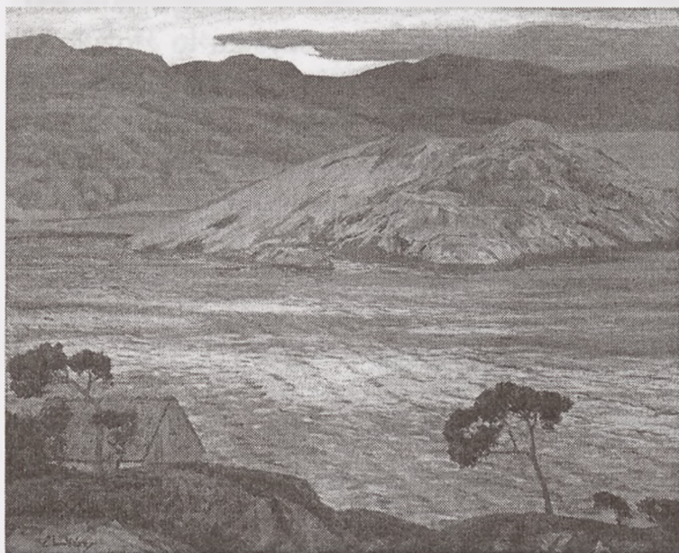
Walter Leistikow, Pejzaż norweski (Wieczór) , przed 1904, olej, płótno, nr inw. MOB/SO.2, własność: Muzeum Okręgowe im. Leona Wyczółkowskiego w Bydgoszczy