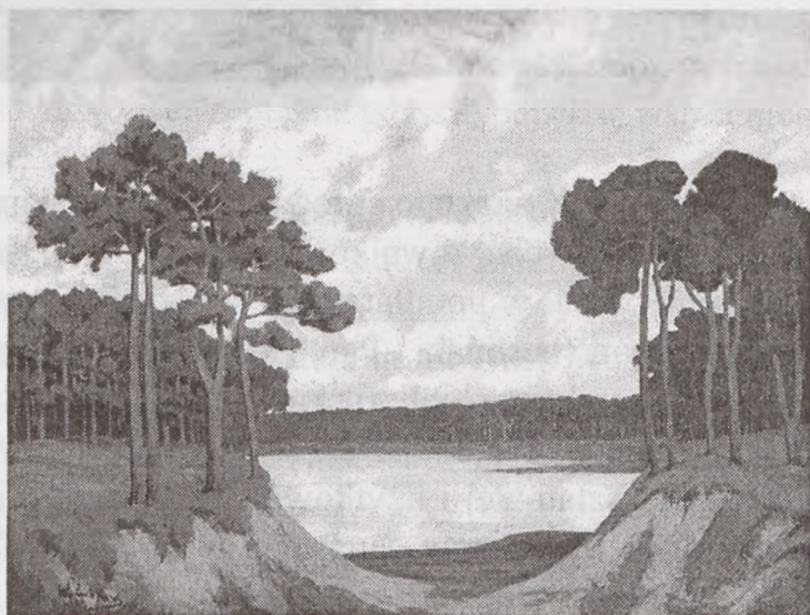
Walter Leistikow, Pejzaż z Grunewaldu (Widok na Jezioro Hawelskie), 1900-1905, olej, płótno, nr inw. MOB/SO.8, własność: Muzeum Okręgowe im. Leona Wyczółkowskiego w Bydgoszczy