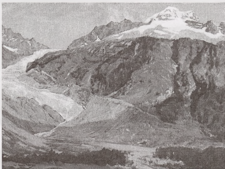
Walter Leistikow, Góry , ok. 1905, gwasz, papier, nr inw. MOB/SO.16, własność: Muzeum Okręgowe im. Leona Wyczółkowskiego w Bydgoszczy