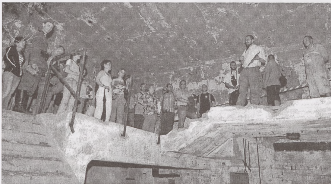
Zwiedzanie poniemieckiej fabryki uzbrojenia DAG

* 28 czerwca 2008 roku byliśmy w poniemieckiej fabryce uzbrojenia DAG Fabrik Bromberg. Uczestnicy wycieczki mieli okazję obejrzeć kolejny fragment unikatowego zakładu zbrojeniowego z pierwszej połowy XX wieku znajdujący się na terenie Bydgoskiego Parku Przemysłowego. Był to Wydział produkcji Prochu POL-BETRIEB, tzw. krąg walcarek, przy ul. Emilianowskiej. Specjalną atrakcją były potężnie obwałowane budynki magazynowe ze specjalnymi łukowymi wjazdami, a także Grupa Rekonstrukcji Historycznej „Ariergarda” z Gdańska (SS-mani), która na koniec zadziwiła nas paradnym pokazem musztry niemieckiej oraz Bydgoska Grupa Rekonstrukcji Historycznej (jeńcy angielscy).