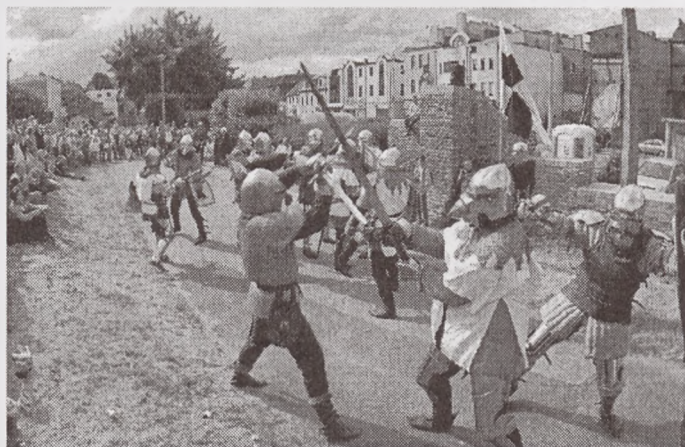
Animacja historyczna ze zdobywania Zamku Bydgoskiego przez rycerzy Władysława Jagiełły

* 15 grudnia byliśmy w Porcie Lotniczym im. I.J. Paderewskiego przy al. Jana Pawła II. Była to okazja do przypomnienia tradycji lotniczych przewozów pasażerskich sięgających 1929 roku. Zwiedziliśmy miejsca bagażowni, odpraw pasażerskich, obserwowaliśmy odloty i lądowania samolotu, a następnie wszyscy udali się zabytkowym „ogórkiem” na objazd terenu lotniska. Pomocy w organizacji wycieczki udzieliło Bydgoskie Stowarzyszenie Miłośników Lotnictwa „EPBY Spoting Team”.