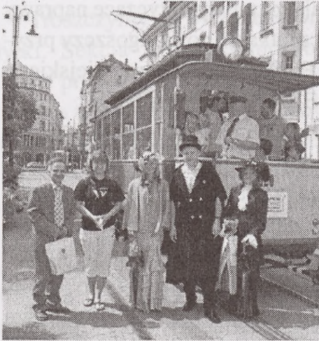
Poczta tramwajowa podczas uroczystości 120-lecia komunikacji miejskiej w Bydgoszczy

* Z okazji 120-lecia komunikacji miejskiej w Bydgoszczy Towarzystwo Miłośników Miasta Bydgoszczy wspólnie z Miejskimi Zakładami Komunikacyjnymi Sp. z o.o., Urzędem Miasta Bydgoszczy, Zarządem Dróg Miejskich i Komunikacji Publicznej, Centrum Poczty Oddziałem Regionalnym, Stowarzyszeniem Inżynierów Techników Komunikacji RP Oddział w Bydgoszczy zorganizowało uroczystości dla bydgoszczan. 30 maja w Sali Sesyjnej ratusza