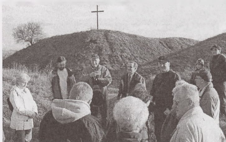
Wyszogród. Uczestnicy wycieczki byli świadkami zdobycia grodziska przez wojów Bolesława Krzywoustego