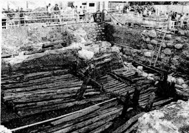
Bydgoszcz, stanowisko 603. Mostowa 4. Dzień oglądania wykopalisk. Zwiedzanie

Prócz niewątpliwych walorów naukowych, wykopaliska stały się na moment „żywą” lekcją historii. Zorganizowany dzień oglądania wykopalisk przyciągnął tłumy bydgoszczan, liczone na 3-5 tysięcy zwiedzających. Zwiedzanie wykopalisk odbyło się pod hasłem – „Pożegnanie ze średniowieczną Bydgoszczą”. Zwiedzający mieli jedyną tego typu okazję zapoznać się z prowadzonymi w terenie pracami archeologicznymi, aktywnie uczestnicząc w odsłanianiu średniowiecznej, drewnianej zabudowy. Odwiedzinom towarzyszyła „polowa” wystawa odkrytych zabytków kultury materialnej i szczegółowe wyjaśnienia na temat prowadzonych prac.