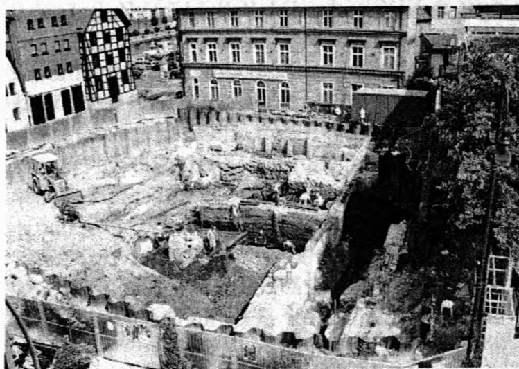
Bydgoszcz, stanowisko 603. Mostowa 4. Widok ogólny wykopalisk

składające się z kolejnych poziomów drewna (pozostałości drewnianej zabudowy) i mierzwy (odchodów zwierzęcych, słomy, siana, ścinek drewna), dały podstawę do określenia czasu powstania pierwszych budynków i tym samym momentu wytyczenia działek budowlanych w tej części miasta.