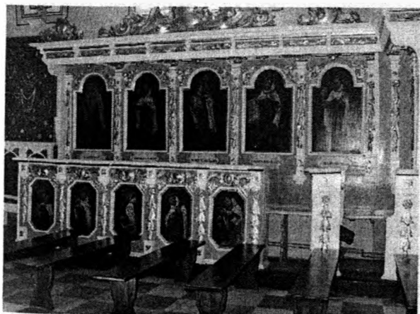
Stalla południowa w kościele w Oborach

nia z nieba, który zstąpił na jego wołanie na górze Karmel 17 . Dalej św. Telesfor papież, z kielichem i trzema hostiami, święty Piotr Tomasz w infule, z krzyżem i zwojem. Obok, w środkowym polu zaplecków, znajduje się wyobrażenie świętego Alberta Avogardo, w infule i czerwonym paliuszu z pastorałem, patriarchy Jerozolimy, który w latach 1207-1209 opracował pierwszą regułę dla zakonu karmelitów, zginął w 1214 roku zaszytowany w czasie procesji 18 . Następna postać, ukazana z pastorałem i lilią w prawej dłoni, to święty Andrzej Corsini, biskup w analogiczny sposób przedstawiony na obrazie w Bydgoszczy. Na ostatnim obrazie w zaplecku znajduje się wizerunek świętego Alberta z lilią przytu-