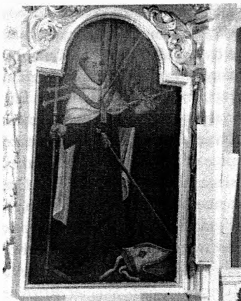
Wyobrażenie świętego Gerarda w zaplecku stali północnej z Obór