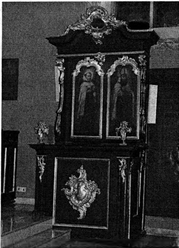
Dwusiedziskowa stalla południowa z Bydgoszczy

Nieznanym z imienia malarz każdą z opisanych tutaj postaci ukazał w zbliżony sposób. Wszyscy stoją i są zwróceny w trzech czwartych w jedną ze stron, tło dla ich głów stanowią koliste, złociste nimby ujęte czerwoną lamówką, ponadto niezależnie od tego, kim byli i w jakim żyli czasie, są ubrani w karmelitańskie habity złożone z czarnej tuniki przepasanej skórzanym pasem i narzuconego na nią białego szkaplerza z doszytym kapturem. Papież na głowach mają tiary, biskupi infuły, a pozostali zgodnie z zakonną tradycją posiadają wygolone tonsury. Najciekawsze jednak jest to, że święci zostali zróżnicowani pod względem wzrostu, postury i rysów twarzy. Duży stopień zindywidualizowania pozwala sądzić, że są to portrety osób współczesnych artyście, prawdopodobnie bydgoskich karmelitów. Bohaterowie poszczególnych obrazów mają twarze młodsze i starsze, raz okrągłe,