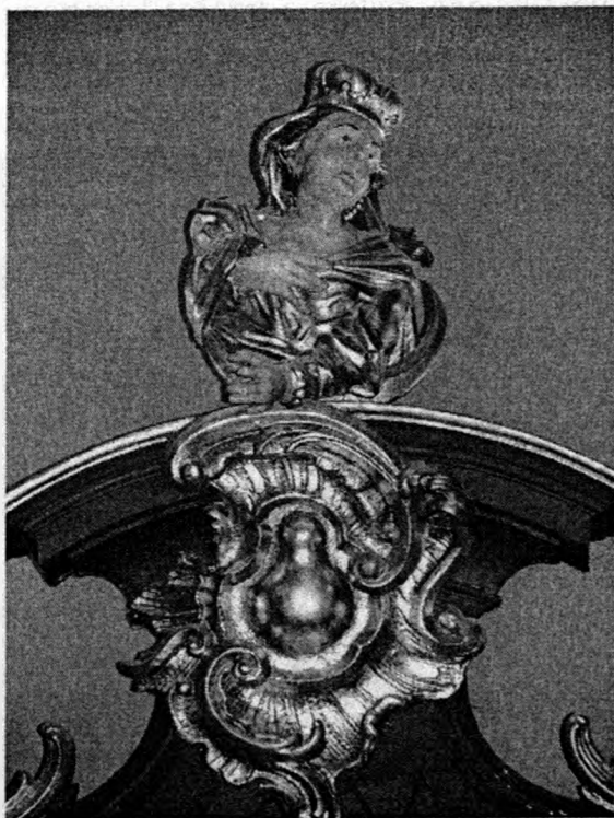
Rzeźba Najświętszej Marii Panny w zwieńczeniu stali północnej Bydgoszczy