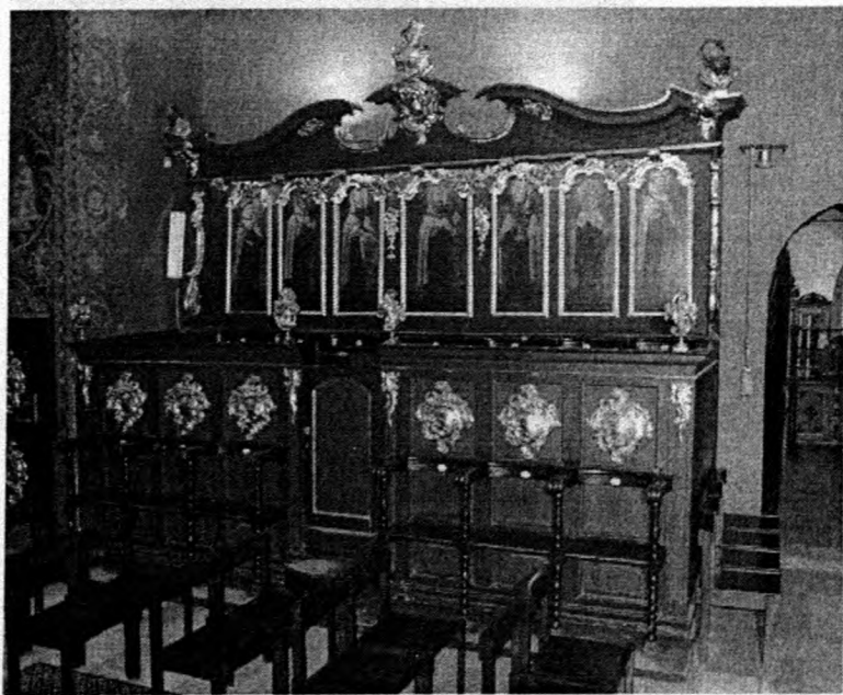
Siedmiosiedziskowa stalla północna z Bydgoszczy

Poczet świętych otwiera ukazany w północnej stalli, w pierwszym zaplecku od zachodu, błogosławiony Anioł, męczennik jerozolimski [S: ANGELUS MAR: IEROSOLYMITANUS]. Był jednym z pierwszych karmelitów, zginął ok. 1220 roku, w Licata na Sycylii, z rąk mężczyzny, któremu kaznodzieja wypomniał złe, nieobyczajne życie. Na obrazie został namalowany z zamkniętą księgą, palmą z trzema koronami oraz mieczami wbitymi w jego pierś i głowę na znak męczeńskiej śmierci. W 1459 roku papież Pius II zaaprobował