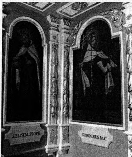
Obrazy świętych: proroka Elizeusza i papieża Dionizego w zapleckach stalli północnej z Obór

W południowej stalli, kolejno od strony nawy, w zapleckach umieszczono pięć obrazów. Pierwsze malowidło na bocznej ścianie wyobraża świętego Elizeusza proroka z laską i dzbanem, ukazanego jako patrona zakonu, w habicie karmelity. Na następnym obrazie znajduje się święty papież Dionizy, w tiarze z pastorałem i otwartą księgą, która nie występuje na jego bydgoskim obrazie. Obok ukazany święty, eksponujący otwartą księgę, przywołuje postać św. Cyryla Aleksandryjskiego, o czym świadczy napis odnoszący się do dogmatu Maryi Bogarodzicy. Na sąsiednich obrazach, tak samo jak w Bydgoszczy, obok siebie ukazani zostali dwaj męczennicy: błogosławiony Anioł karmelita, zobrazowany z tytułu męczeństwa z mieczem przeszywającym jego serce i palmą z trzema koronami 13 w lewej dłoni oraz święty Gerard, apostoł Węgier. Różnice w sposobie zilustrowania ich świadczą o samodzielności autorów. Szczególnie dobrze jest to widoczne, jeśli porównamy wizerunki świętego Gerarda. Na obrazie bydgoskim widzimy insygnia władzy biskupiej i włócznię przebijającą pierś. Na przedstawieniu z Obór występuje więcej atrybutów, oczywiście włócznia tkwi w piersi, jednak infuła leży na ziemi, podobnie jak zamknięta księga. Interesujący jest fakt, że święty w lewej dłoni trzyma berło i koronę, być