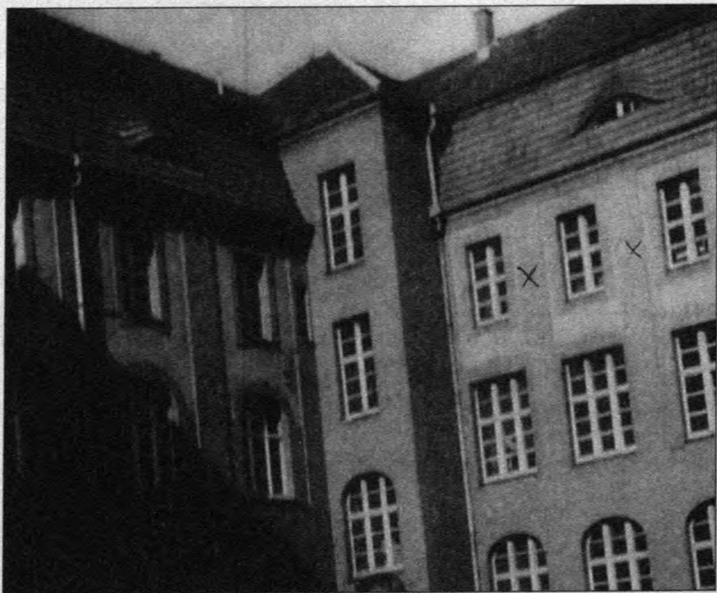
Widok budynku od strony podwórza (1943 r.) (x – okna pokoi mieszkalnych studentek).