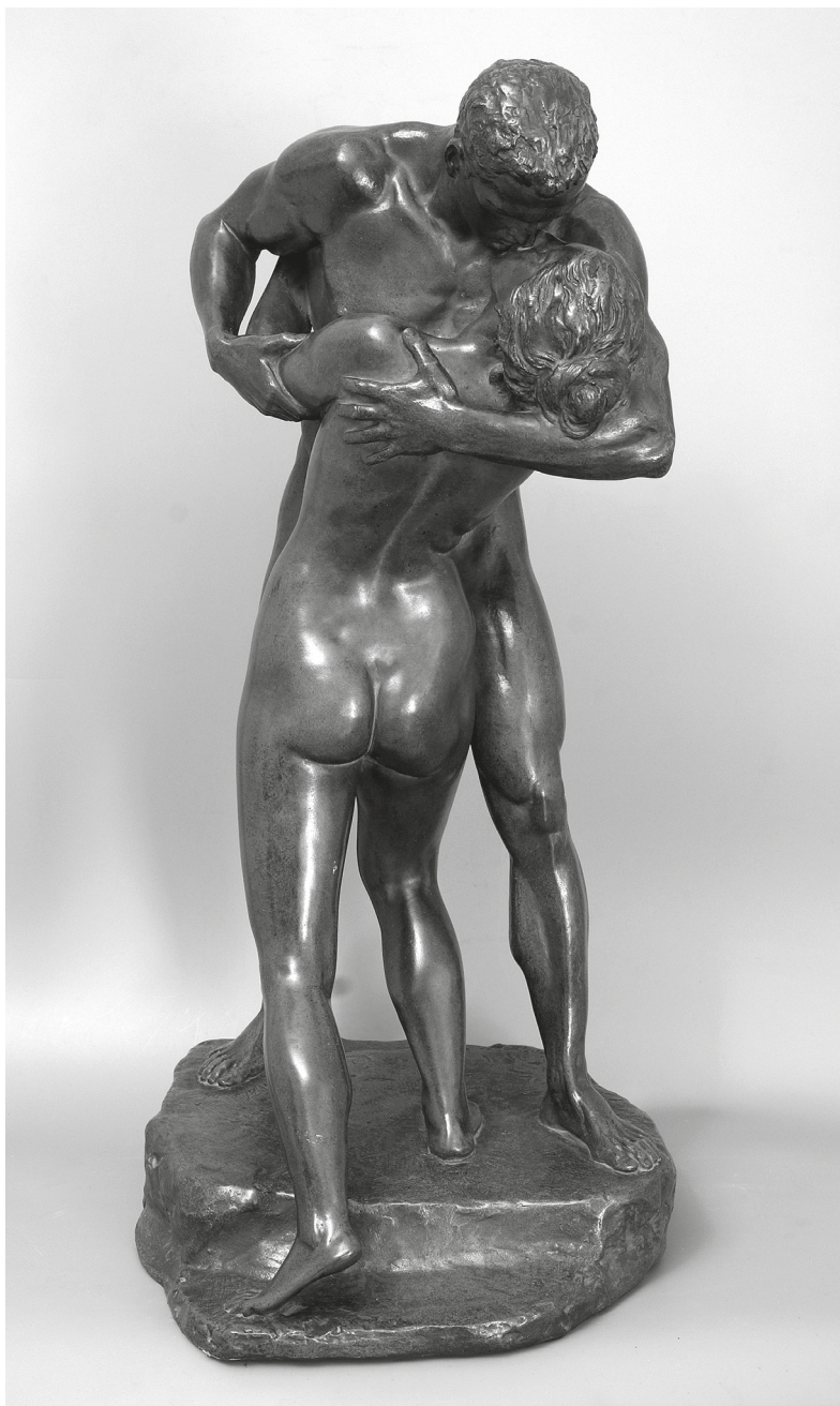
Ferdinand Lepcke, Pocałunek , 1904, brąz, wym. 58 x 29 cm, wł. MOB, nr inw. MOB/SR/98, fot. W. Woźniak.