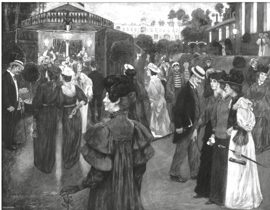
Hans Baluschek, Tanzmachen , 1904, pastel, tempera, gwasz, wym. 76 x 100 cm, sygn. na odwrociu: BALUSCHEK/1904, wł. MOB, nr inw. MOB/SO/106.

(1901) 66 . Cztery pozostałe obrazy Baluschka wykonane były w charakterystycznej dla twórcy technice mieszanej akwareli i pastelem, m.in. Tańczące dziewczęta .