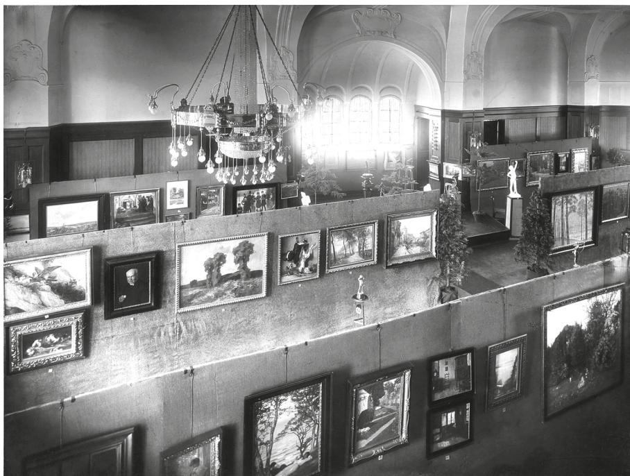
Wystawa sztuki, 1910 (?), Miejska Wyższa Szkoła Realna (Städtische Ober-Realschule), wł. MOB, nr inw. MOB/H/F-2275/W-12, fot. W. Woźniak.

tej ukazano różne ośrodki sztuki 79 . Artystów zaproszono publicznie do udziału w wystawie, a zainteresowanie było tak znaczne, że musiano zrezygnować z części prac. Minde-Pouet podkreślił, że nawiązano kontakty z większością artystów i wyborów dokonywano bezpośrednio w ich pracowniach. Zaakcentował przy tym, że część z tych twórców znana jest już publiczności z wystawy zorganizowanej w 1905 roku. Zdaniem autora wystawa odbywała się w „pięknej, szerokiej i jasnej auli miejskiego gimnazjum, specjalnie przygotowanej i wyposażonej”.