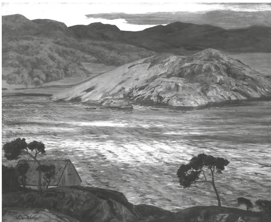
Walter Leistikow, Pejzaż norweski , 1889, olej na płótnie, wym. 110 x 135 cm, sygn. l.d.: W. Leistikow, wł. MOB, nr inw. MOB/SO/2, fot. W. Woźniak.

i cenionych malarzy niemieckich XIX wieku – pejzażysta, a przede wszystkim marynista, autor nastrojowych widoków morskich znad Morza Północnego i Bałtyckiego, a także widoków Bretanii i Norwegii 45 . W Bydgoszczy zaprezentował trzy widoki z Pomorza, Rygi i Szkocji. Obrazy malarza były często kopiowane, a kopie jego prac pojawiały się także na wystawach bydgoskiego Kunstvereinu.