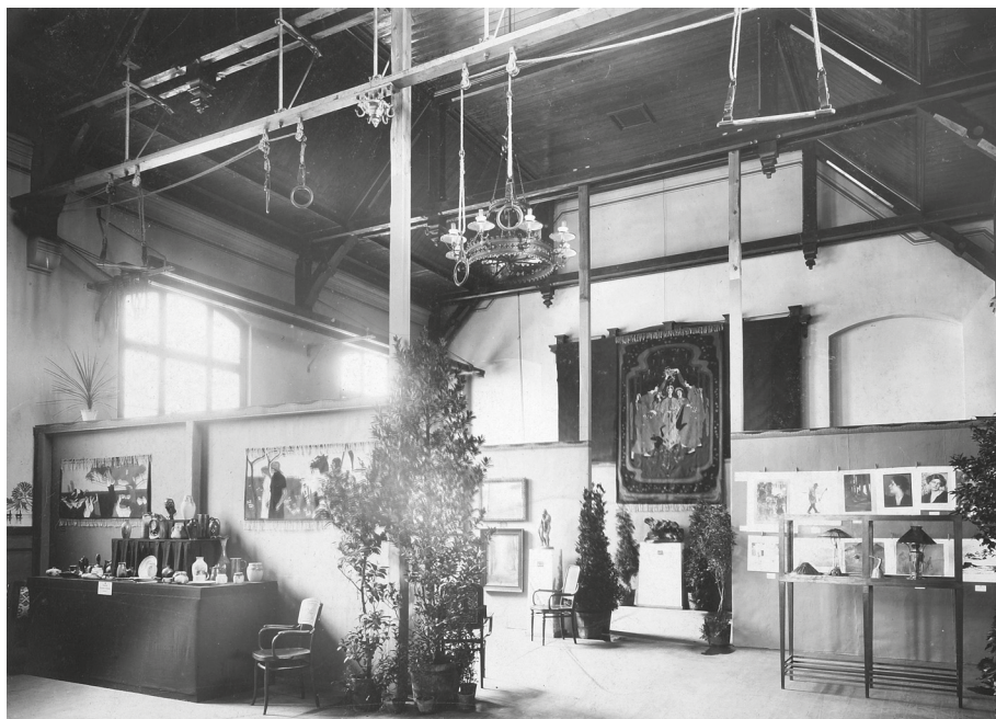
Wystawa sztuki, 1903 lub 1905, Miejska Sala Gimnastyczna (Städtische Turnhalle, Schulstrasse), wł. MOB, nr inw. MOB/H/F-2276/W-13, fot. W. Woźniak.

Zachowały się cztery katalogi z lat 1905-1912, wskazujące, że ekspozycje organizowano co dwa – trzy lata. Cztery udokumentowane wydawnictwami wystawy zostały zaprezentowane w różnych miejscach: I. Wystawa w Miejskiej Sali Gimnastycznej (Städtische Turnhalle) przy Schulstrasse, II. i III. w Auli nowej wówczas Szkoły Realnej (Aula der Neuen Realschule in der Schillerstrasse, a po zmianie nazwy: Aula der Städt. Ober-Realschule), IV. w Królewsko-Pruskiej Szkole Rzemiosła i Przemysłu Artystycznego (Kgl. Preussischen Handwerker und Kunstgewerbeschule). Punktem odniesienia dla wszystkich ekspozycji była aktualna sztuka niemiecka, jednak starano się poszczególnym wystawom nadać charakter problemowy, akcentując wybrane zjawiska współczesne, a także historyczne, osadzając je w określonym kontekście. Podobnie, jak w odniesieniu do wystaw Kunstvereinu, wszystkie wystawy posiadały charakter komercyjny, chociaż nie wszystkie prace przeznaczone były na sprzedaż; w katalogach nie podawano cen, informacje te można było pozyskać u obsługi.