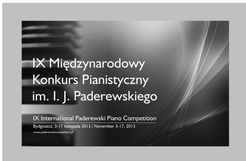
Rycina 2. Afisz IX Konkursu I.J. Paderewskiego

IX Międzynarodowy Konkurs Pianistyczny im. I.J. Paderewskiego przewidziany jest na 3-17 listopada 2013 roku. Przesłuchania konkursowe będą otwarte dla publiczności i zostaną przeprowadzone w salach koncertowych Akademii Muzycznej i Filharmonii Pomorskiej im. I.J. Paderewskiego w Bydgoszczy, co z pewnością przyciągnie wielu młodych i starszych melomanów.