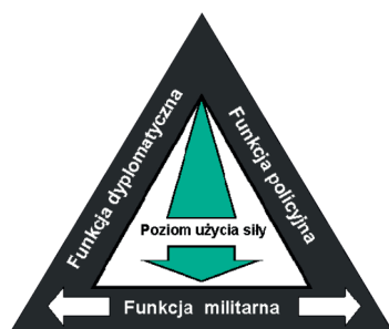
Rysunek 3. Podstawowe funkcje realizowane przez współczesne siły morskie

W ramach tych trzech funkcji siły morskie realizują zadania w zakresie ochrony i obrony interesów państwa. Zadania w ramach funkcji dyplomatycznej i militarnej będą miały na celu przede wszystkim utrzymanie lub wzmocnienie pozycji państwa na arenie międzynarodowej. Natomiast obrona terytorium państwa pozostaje domeną funkcji militarnej. Dodatkowo, siły morskie, ze względu na swoją specyfikę, charakteryzują się możliwością prowadzenia całego spektrum działań militarnych i pozamilitarnych, są autonomiczne pod względem logistyki oraz dysponują swobodą działania wynikająca z praw żeglugowych na akwenach morskich (Szubrycht, 2010).