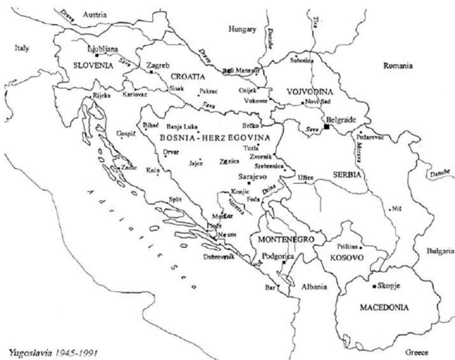
Rysunek 1. Mapa byłej Jugosławii

państwo jugosłowiańskie zorganizowano na zasadach federacyjnych, tworząc sześć nominalnie równorzędnych republik: serbską, chorwacką, słoweńską, bośniacko-hercegowińską, macedońską i czarnogórską. W skład Ludowej Republiki Serbii weszły dwa terytoria wydzielone: Kraj Autonomiczny Wojwodina oraz mniejszy rangą Obwód Autonomiczny Kosowsko-Metochijski 5 .