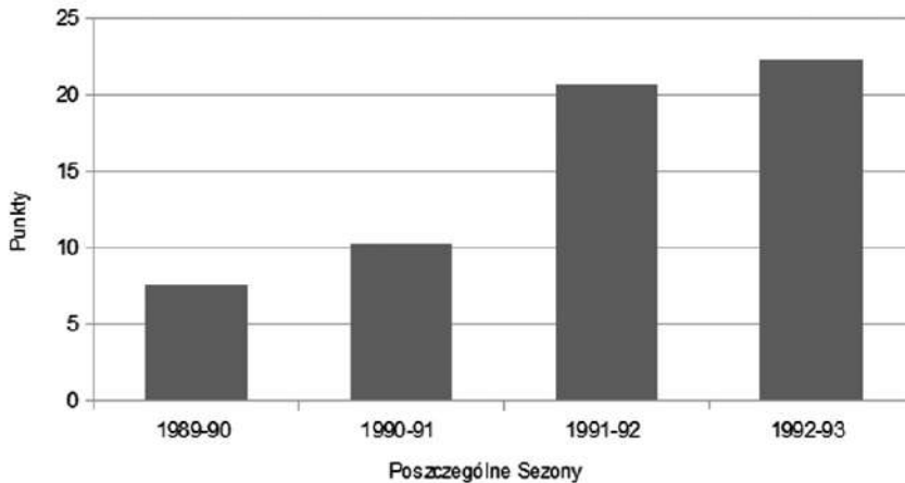
Rys. 3. Wykres kolumnowy ilustrujący udział Drażena Petrovicia w meczach NBA w poszczególnych sezonach gry