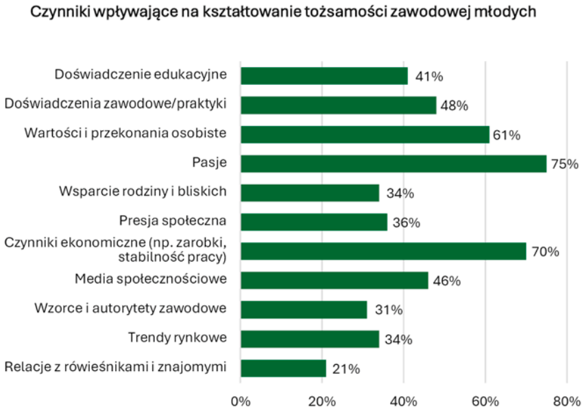
Wykres 7 Determinanty tożsamości zawodowej młodych dorosłych