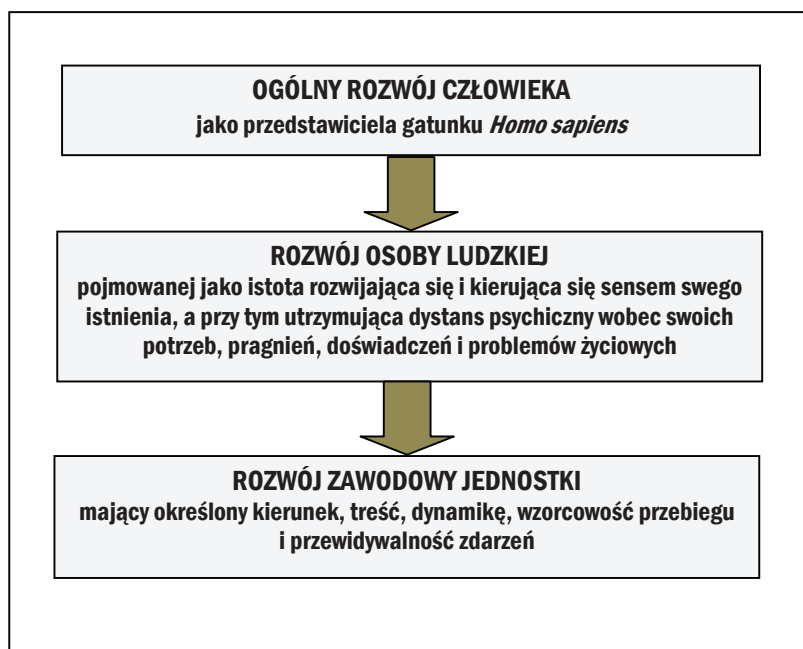
Rysunek 1. Rozwój zawodowy jednostki ludzkiej w szerszym kontekście kategorii rozwoju człowieka

w kierunku wytyczonym przez sens własnego życia bądź czynniki decydujące o tym, że życie zawodowe przebiega (toczy się) w taki, a nie inny sposób. Istotą tak rozumianego rozwoju zawodowego jednostki jest zmierzanie w kierunku profesjonalizmu. Można zatem przyjąć, że u podstaw tak rozumianego rozwoju zawodowego jednostki leży chęć zaspokajania jej potrzeb oraz sens życia. Tak rozumiany rozwój zawodowy wpisuje się w charakterystykę działań podejmowanych przez jednostkę „w celu kształtowania samego siebie i przez to swojego bliższego i dalszego otoczenia” 3 i można go ująć w następujący sposób (rys. 1).