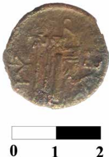
Рис.7. Обратная сторона меньшего «борисфена» (находка 2019 г.).

Что касается этого дифферента, состоящего из двух четко написанных и соединенных между собой букв \phi\zeta , то П.О. Карышковский назвал его неподдающейся расшифровке монограммой 15 . Эта монета и по своему размеру, и по весу, и по дифференту относится к более поздним группам «борисфенов», что хорошо видно в таблице дифферентов П.О. Карышковского 16 . Очевидно, под этой монограммой скрывается один из представителей высшей ольвийской элиты с именем, начинающимся на ФР.