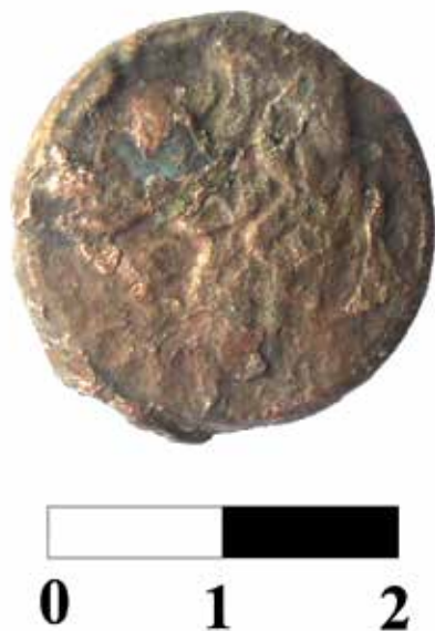
Рис. 6. Лицевая сторона меньшего «борисфена» (находка 2019 г.).

Вторая обнаруженная в 2019 году монета-«борисфен» имеет такие характеристики: диаметр: 20 миллиметров, толщина монетного кружка: 2,4–2,5 миллиметра, вес: 7,2 грамма (Рис. 6, 7). В отличие от предыдущей монеты, ее гурт имеет четко выраженный скошенный край, особенно характерный для большинства «борисфенов» поздних групп. Изображение головы речного божества Борисфена на аверсе монеты полностью поместилось на монетном кружке, но выглядит не очень четко. На реверсе монеты хорошо видно следы сдвига штемпеля – характерный бортик, расположенный возле верхней части лука и секиры. Из-за этого сдвига на монетном кружке не поместилась нижняя часть надписи-этникона ОЛВЮ и нижняя часть второй литеры дифферента – развернутой в обратную сторону литеры ꝛ (Рис. 7).