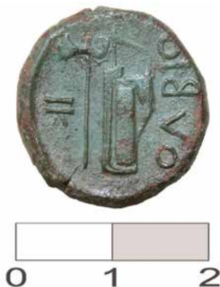
Рис. 3. Обратная сторона «борисфена» из с. Натягайловка.

После промывки дистиллированной водой и просушки монета имеет зеленоватую и коричневатую патину. Несмотря на длительное пребывание в грунте, общее состояние монеты хорошее. На лицевой стороне находится достаточно четкое выпуклое изображение бородатого и рогатого божества реки Борисфен. Рельеф изображения достаточно высокий, практически все детали хорошо просматриваются: вертикально размещенный рог, узкая налобная повязка, широкие профилированные пряди волос на голове, узкие пряди волос бороды, резко отделенный от края монеты обрез шеи. Изображение Борисфена передано высокохудожественно, мастер-резчик, похоже, имел высокую квалификацию и пытался передать антропологические особенности лица скифа ( Рис. 2 ).