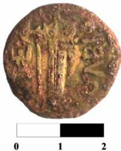
Рис. 5. Обратная сторона большого «борисфена» (находка 2019 г.).

Что касается монограммы на обратной стороне «борисфена», то она относится к сложному типу дифферентов и уже рассматривалась нами выше. В этой монограмме соединены вместе три литеры ЕКА (Рис. 5). Но П.О. Карышковский считал, что она читается как ЕПА, и что в монограммах, «несомненно состоящих из букв ЕПА, заключено скорее всего имя одного лица. В Ольвии имена с такой начальной частью неизвестны, но в милетских надписях встречается Ἐλαδέτινον . Это последнее связывается со сравнительной степенью прилагательного ἀγαθός (отличный, доблестный, благородный)» 12 .