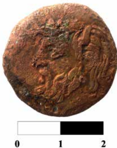
Рис. 4. Лицевая сторона большого «борисфена» (находка 2019 г.).

Более крупная из них имеет такие характеристики: диаметр: 24,5 миллиметра, толщина монетного кружка: 2 миллиметра, вес: 10,95 грамма ( Рис. 4, 5 ). Монетный кружок имеет не очень круглую (несколько многоугольную) форму и, вместе с достаточно большим размером монеты, вызывает подозрения в ее перечеканке из более ранней, вышедшей из употребления ольвийской меди. Похоже, что мастер перед чеканкой немного прошелся молотком по ее гурту, слегка приплюснул его, чтобы уменьшить размер будущей монеты, подогнав его под тогдашний стандарт «борисфена». Кроме того, обращает внимание, что реверс монеты имеет небольшие следы бортика с разных его сторон. Так бывает при сдвиге штампера в сторону во время удара, однако в данном случае все изображение реверса четко поместилось на монетном кружке: и этникон ОЛВІО на одном краю, и сложная монограмма на противоположном.