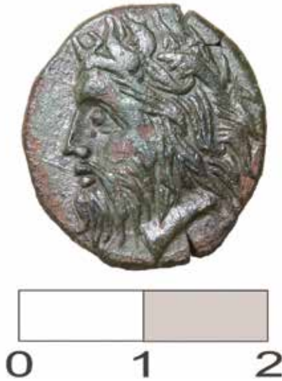
Рис. 2. Лицевая сторона «борисфена» из с. Натягайловка.

Весной 2011 года в лабораторию археологических исследований при кафедре истории и культуры Украины Переяслав-Хмельницкого государственного педагогического университета имени Григория Сковороды была передана чрезвычайно интересная находка – ольвийская бронзовая монета «борисфен» (Рис. 2, 3). Она была случайно обнаружена недалеко от современного села Натягайловка, на территории бывшего села, на берегу небольшой реки Броварки (Супротивки) 7 .