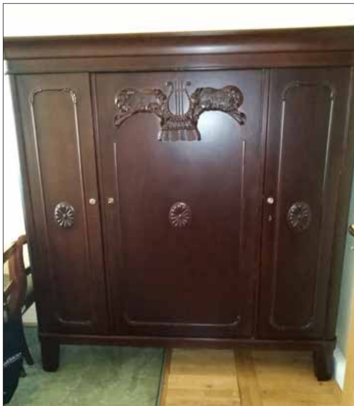
Ryc. 6. Szafa z 1931 r., z symbolem liry i napisem:

Tow. Śpiewu (w wieńcach) oraz zatartym imieniem św. Cecylii (pod lirą)