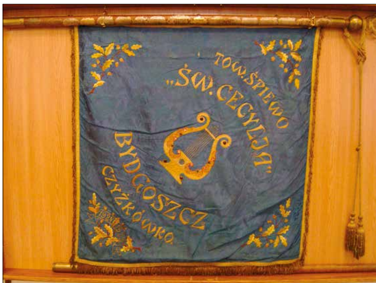
Ryc. 5. Sztandar Towarzystwa Śpiewu św. Cecylia.

w salce parafialnej zaprezentowano amatorskie przedstawienie patriotyczne pt. Na naszej glebie , którego autorką była pisarka i działaczka oświatowa związana z Wielkopolską i Pomorzem – Anna Karwatowa 21 . Uroczystość ta miała swój ciąg dalszy jesienią 1929 roku, kiedy to we wrześniu zorganizowano specjalny koncert połączony z wbijaniem 17 pamiątkowych gwoździ, zebranych na majowych obchodach. Do dziś na sztandarze chóru „Arion” widnieją te dowody szacunku i solidarności różnych środowisk w tworzeniu polskiego ruchu kulturalnego, oświatowego i artystycznego.