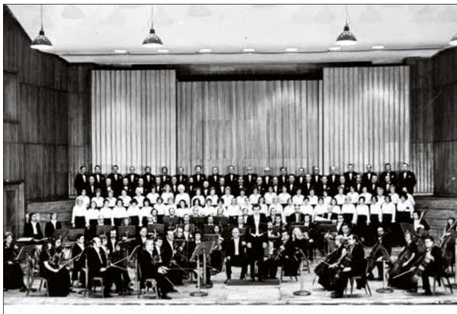
Ryc. 9. Chór „Arion”, Orkiestra Symfoniczna Filharmonii Pomorskiej w Bydgoszczy, dyrygent Antoni Wit, fot. z 1976 r.