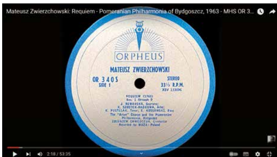
Ryc. 10. Płyta z 1963 r. z pierwszą fonograficzną rejestracją Requiem Mateusza Zwierzchowskiego