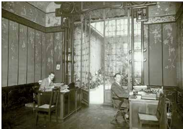
Konsulat Generalny w Paryżu (Paryż, 1928 r.); wyk.: S. Londynski. Zbiory MDiUP, ARP, sygn. 104/1.