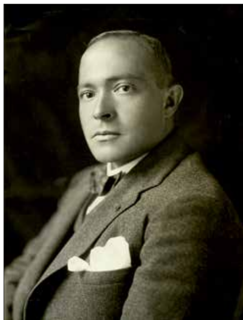
Karol Poznański (Paryż, 1927 r.); wyk.: S. Londynski. Zbiory MDiUP, ARP, sygn. 67.