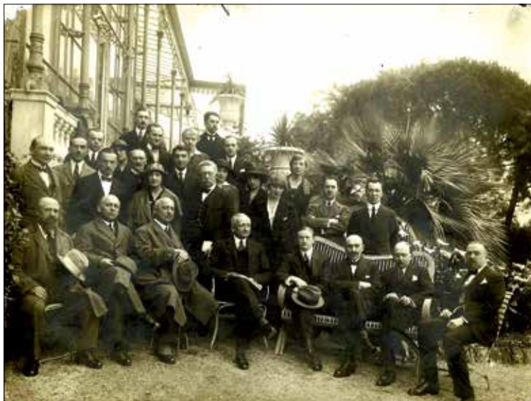
Konferencja ekonomiczna w Genui – delegacja polska pod przewodnictwem Gabriela Narutowicza (Genua, 1922 r.)