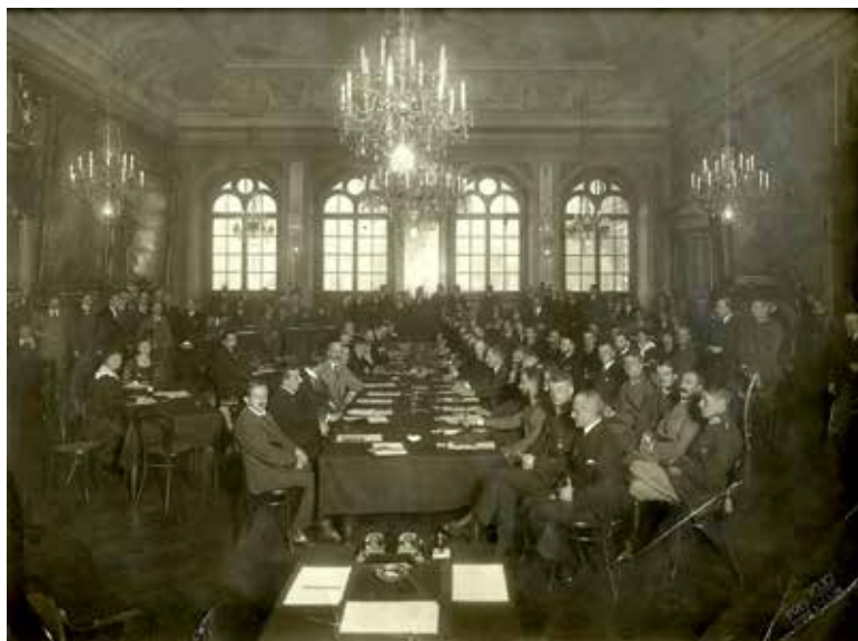
Konferencja pokojowa w Rydze (Ryga, 1920 r.); wyk.: Foto-Klio; zbiory MDiUP, ARP, sygn. 95.