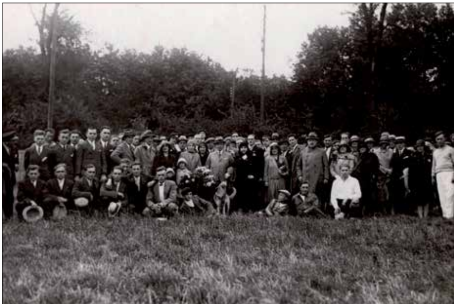
Otwarcie stadionu Towarzystwa Sportowego Pologne w Paryżu (Paryż, 3 sierpnia 1930 r.)

Pewną ciekawostką w zbiorze pozostają pogadanki historyczne Zygmunta Nowakowskiego (1891–1963), wygłaszane na falach Radia Wolna Europa w latach 50. i 60. XX wieku 44 . Zygmunt Nowakowski przez kilkanaście lat mieszkał w londyńskim domu Poznańskich. Kolekcję tworzy blisko 70 pogadań – 345 stron maszynopisu z odręcznymi poprawkami autora.