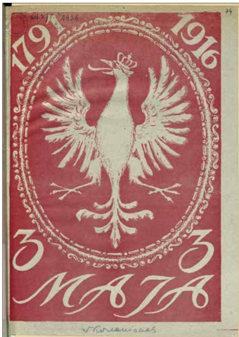
Il. 4. Rocznicowa ulotka opublikowana w Kozienicach w 1916 r.; zbiory WiMBP, sygn. DŹS IV.3.2.3512.

zaproszenie do wzięcia udziału w uroczystościach, składających się m.in. z przemarszu orkiestr wojskowych ulicami miasta, hejnału z wieży kościoła Klarysek, mszy świętej, defilady wojska i organizacji wojskowych, a także igrzysk sportowych (np. w 1934 roku odbył się mecz piłki nożnej