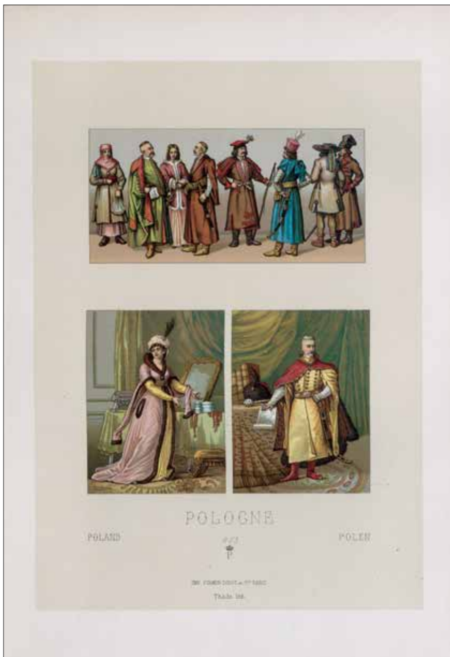
Il. 3. Francuska grafika z połowy XIX w. ukazująca polskie stroje z XVIII w., Pologne – XVIII e et XIX e siècle. Costumes de la Noblesse et de Peuple , Paris [po 1855]; zbiory WiMBP, sygn. Gr 716 III.