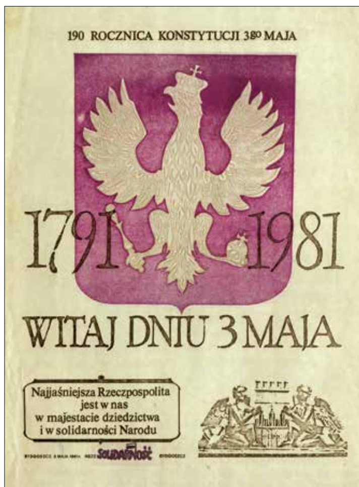
Il. 5. Plakat wydany z okazji 190. rocznicy uchwalenia Konstytucji 3 maja przez NSZZ „Solidarność” w Bydgoszczy; zbiory WiMBP, sygn. VII.7.4.