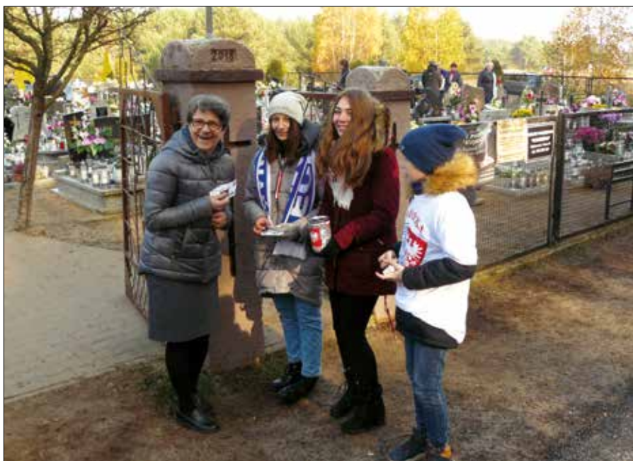
Ryc. 8. Kwesta w Miałach w ramach akcji „Wiara Powstańcom”, 1 listopada 2019 r.

Ciekawym zjawiskiem jest włączenie się kibiców Lecha Poznań do działań na rzecz renowacji mogił powstańczych 88 . W ramach akcji „Wiara Powstańcom” prowadzili oni zbiórki pieniędzy w dniu 1 listopada przed nekropoliami w całej Wielkopolsce. W latach 2010–2015 zebrali ponad pół miliona złotych. Prócz renowacji, we współpracy z Muzeum Powstania Wielkopolskiego sfinansowali także część tabliczek (w ramach akcji oznakowania powstańczych grobów), tablic wskazujących dawne powstańcze siedziby oraz niektóre nowe pomniki. Akcja ta jest kontynuowana.