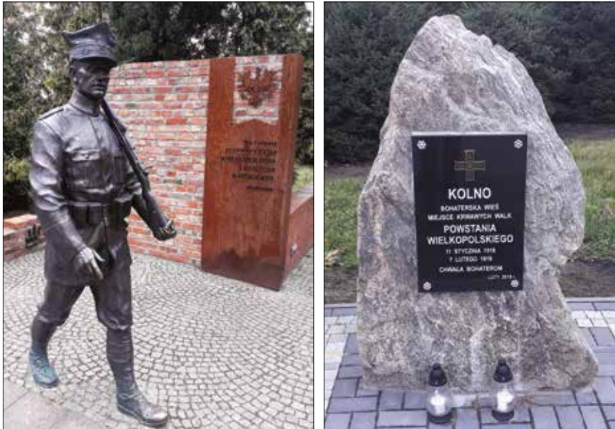
Ryc. 9. i 10. Pomniki upamiętniające walki powstańcze 1919 r. o Kolno (k. Międzychodu) i Czarnków

W 2008 roku zainicjowano cykliczność imprez w Warszawie – 27 grudnia 2008 roku do stolicy udały się delegacje poznaniaków, aby oddać hołd uczestnikom powstania wielkopolskiego przed Grobem Nieznanego Żołnierza, gdzie na tablicach pamiątkowych, prócz samego powstania, wymieniono m.in. walki o poznańskie lotnisko Ławica i Rawicz 96 . Inicjatorzy wyjazdu (Wojewoda Wielkopolski, Zarząd Główny TPPW 1918/1919, Urząd Marszałkowski w Poznaniu) chcieli w ten sposób zwrócić uwagę mieszkańcom stolicy, że zwycięskie powstanie „jest nie tylko czynem regionalnym, że ma ono szersze znaczenie historyczne dla naszej Rzeczypospolitej” 97 . Prócz delegatów z Wielkopolski w uroczystości wzięli udział przedstawiciele Ministerstwa Obrony Narodowej, Województwa Mazowieckiego,