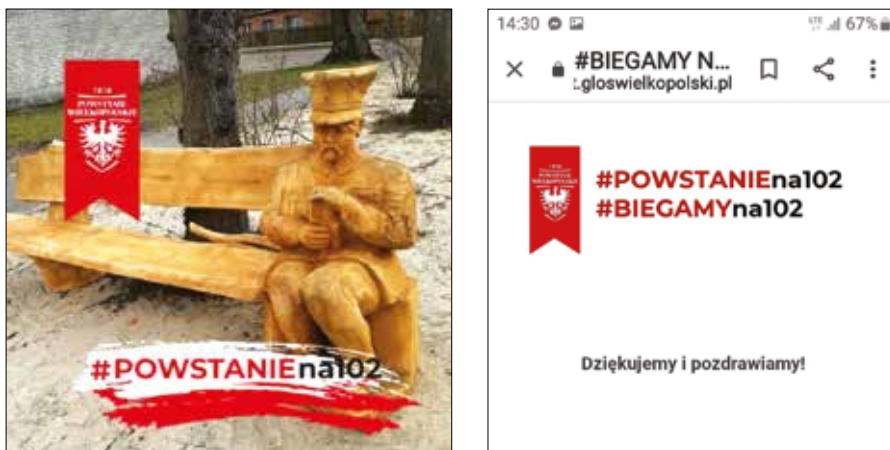
Ryc. 11 i 12. Wirtualne „nakładki” związane obchodami 102. rocznicy powstania wielkopolskiego

Reżim sanitarny zmusił też organizatorów cyklicznych konkursów wiedzy o powstaniu wielkopolskim do przejścia na tryb zdalny przy wykorzystaniu platform generujących testy elektroniczne. Taką formę wybrali m.in. organizatorzy konkursu pn. „Powstańczym szlakiem ku sercu Puszczy Noteckiej” (Miały), przeznaczony dla uczniów szkół podstawowych w powiecie czarnkowsko-trzcianeckim 104 .