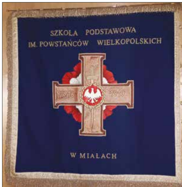
Ryc. 4. Sztandar Szkoły Podstawowej im. Powstańców Wielkopolskich w Miałach

W 1978 roku w Kaliszu odbył się pierwszy ogólnopolski zlot szkół noszących imię (zespołowe lub indywidualnego bohatera) Powstańców Wielkopolskich 1918–1919. Do 2018 roku odbyło się dziewięć takich zlotów 68 .