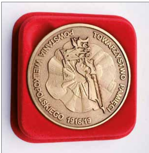
Ryc. 7. Medal pamiątkowy wybitny z okazji 30-lecia Towarzystwa Pamięci Powstania Wielkopolskiego 1918/1919