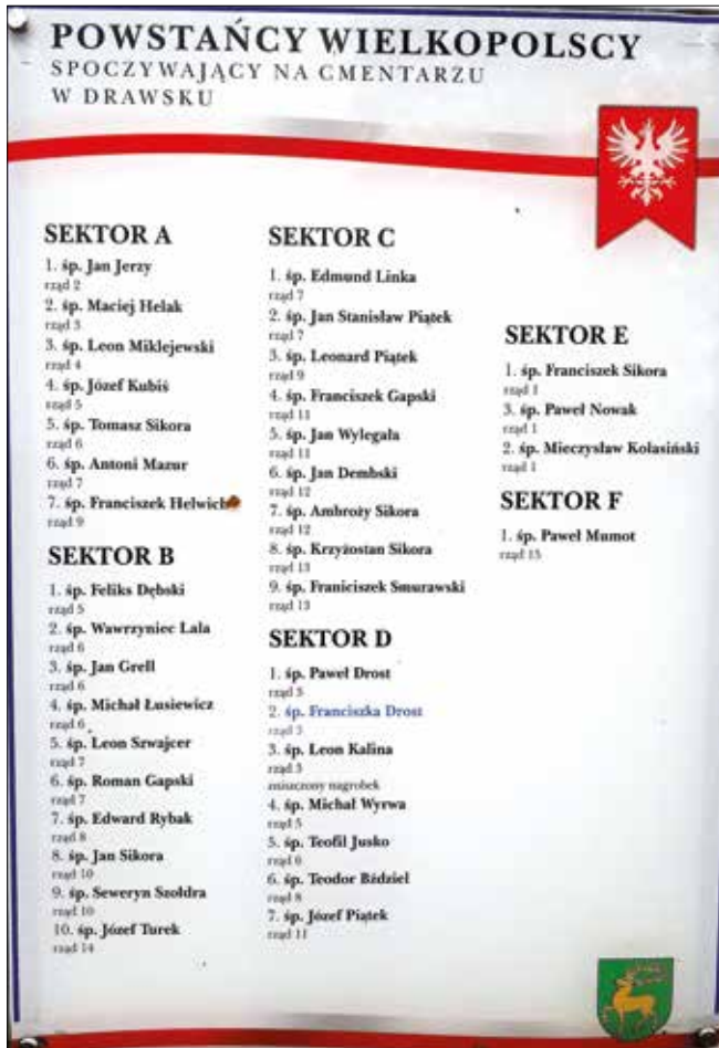
Ryc. 1. Tablica informacyjna przy cmentarzu parafialnym w Drawsku