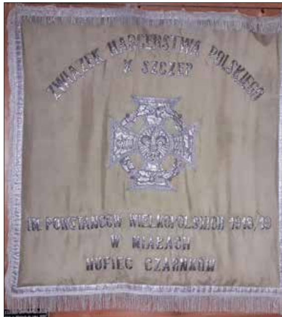
Ryc. 5. Sztandar dawnego X Szczepu ZHP w Miłach im. Powstańców Wielkopolskich

Na fali celebrowania 50. rocznicy powstania władze oświatowe w Poznańskim wydały specjalny okólnik, w którym zalecały szkołom aktywne wzięcie udziału w obchodach poprzez przybliżenie na lekcjach języka polskiego, historii, wychowania obywatelskiego i na godzinach wychowawczych problematyki powstania wielkopolskiego, a także odwiedzenie schorowanych powstańców-kombatantów 73 .