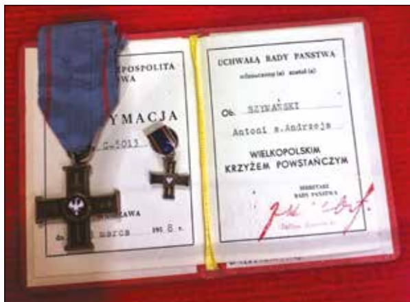
Ryc. 3. Wielkopolski Krzyż Powstańczy wraz z legitymacją w zbiorach Muzeum Powstańców Wielkopolskich w Lusowie