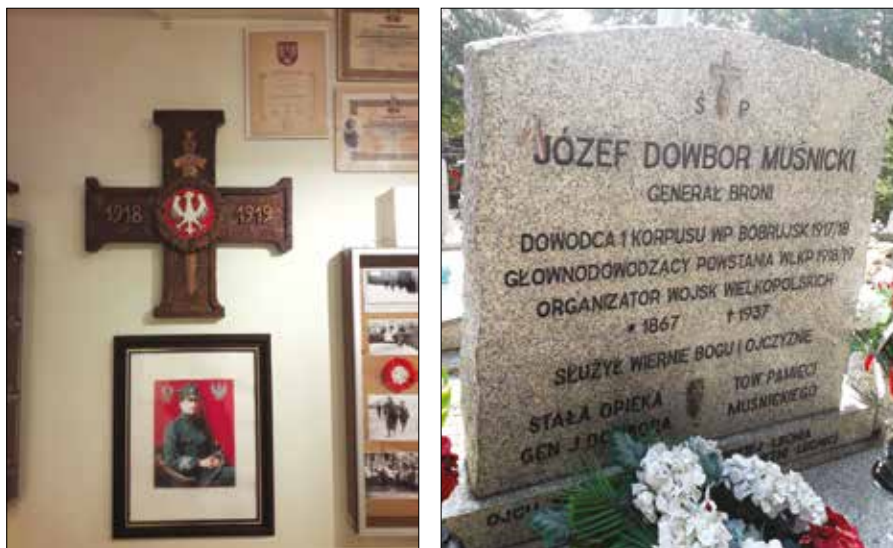
Ryc. 16 i 17. Zbiory Muzeum Powstańców Wielkopolskich w Lusowie oraz pobliska mogiła gen. Józefa Dowbor-Muśnickiego