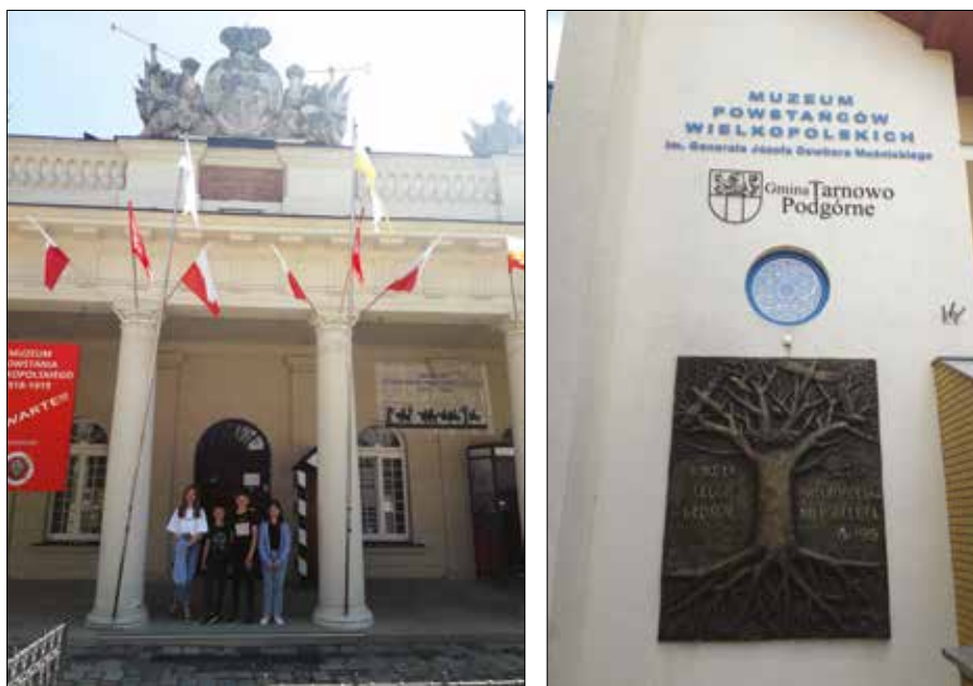
Ryc. 13 i 14. Budynki „powstańczych” placówek muzealnych w Poznaniu i Lusowie

W oparciu o publikacje, dane archiwalne, życiorysy i relacje stworzono internetową bazę liczącą 130 tys. nazwisk 118 .