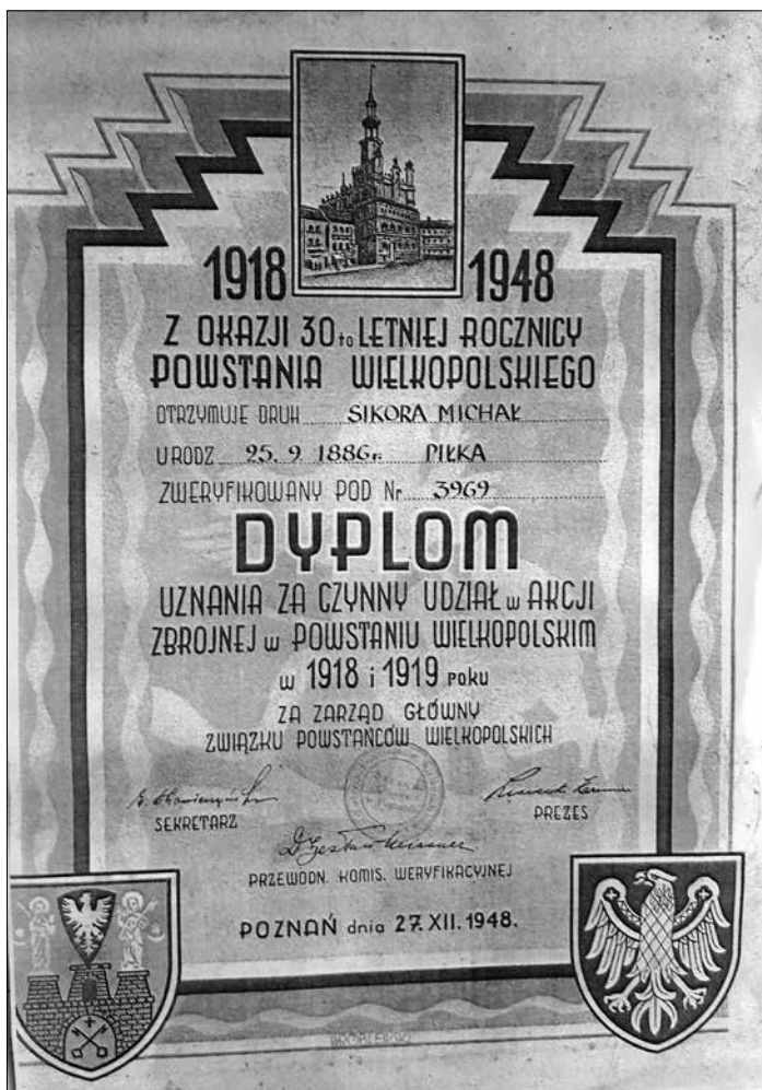
Ryc. 2. Kopia dyplomu wręczanego członkom powojennego Związku Powstańców Wielkopolskich w zbiorach Szkoły Podstawowej im. Jana Pawła II w Piłce

i prowadząc specyficzną, selektywną politykę historyczną, eksponującą wątki antyniemieckie 41 . Dlatego 27 grudnia 1956 roku podczas akademii z okazji 38. rocznicy wybuchu powstania wielkopolskiego