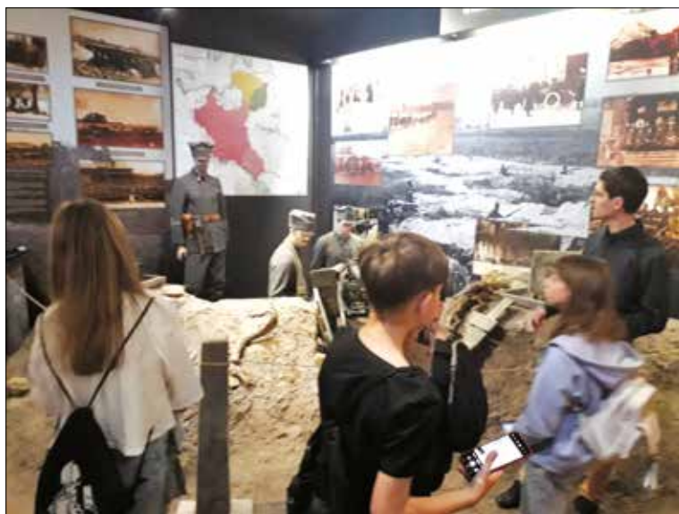
Ryc. 15. Ekspozycja w Muzeum Powstania Wielkopolskiego w Poznaniu

W działania na rzecz podtrzymywania tradycji powstańczych, budowania wiedzy o zrywie niepodległościowym Wielkopolan i edukowania społeczeństwa, przede wszystkim najmłodszego pokolenia, włączyły się liczne placówki muzealne, zwłaszcza Muzeum Powstania Wielkopolskiego 1918–1919 w Poznaniu (będące częścią Wielkopolskiego Muzeum Niepodległości) i Muzeum Powstańców Wielkopolskich im. Generała Józefa Dowbora-Muśnickiego w Lusowie. Pierwsza z wymienionych placówek ukazuje genezę powstania, czyli długotrwałe zmagania Wielkopolan w zaborze pruskim z uciskiem narodowościowym i ekonomicznym, a następnie najważniejsze etapy walki zbrojnej 119 . Drugie z muzeów przede wszystkim eksponuje pamiątki pozostawione przez powstańców, poświęcając sporo uwagi generałowi Dowbor-Muśnickiemu i jego rodzinie 120 .